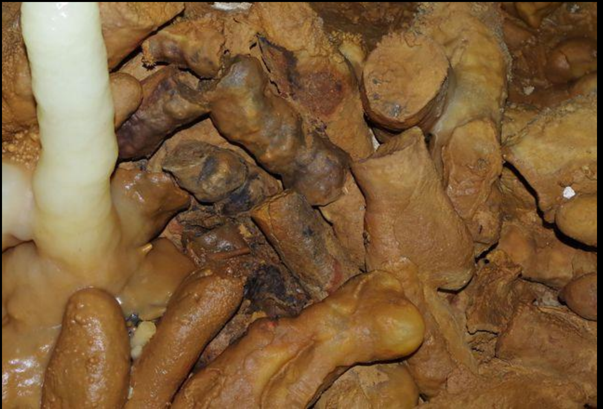
Os detalhes de estalagmites com vestígios de carbonização sugerem a existência de fogueiras em tempos remotos.