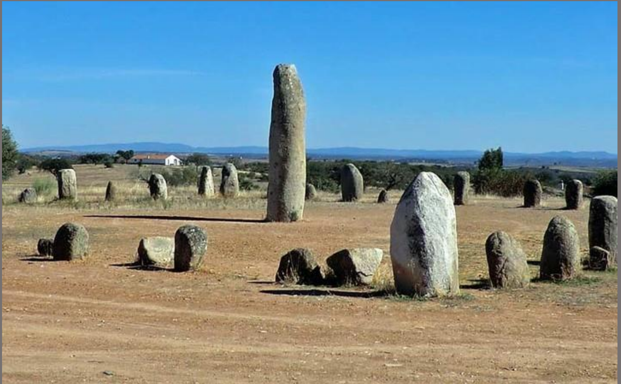
Circular, Cromeleque de Xarez Stone, Portugal.