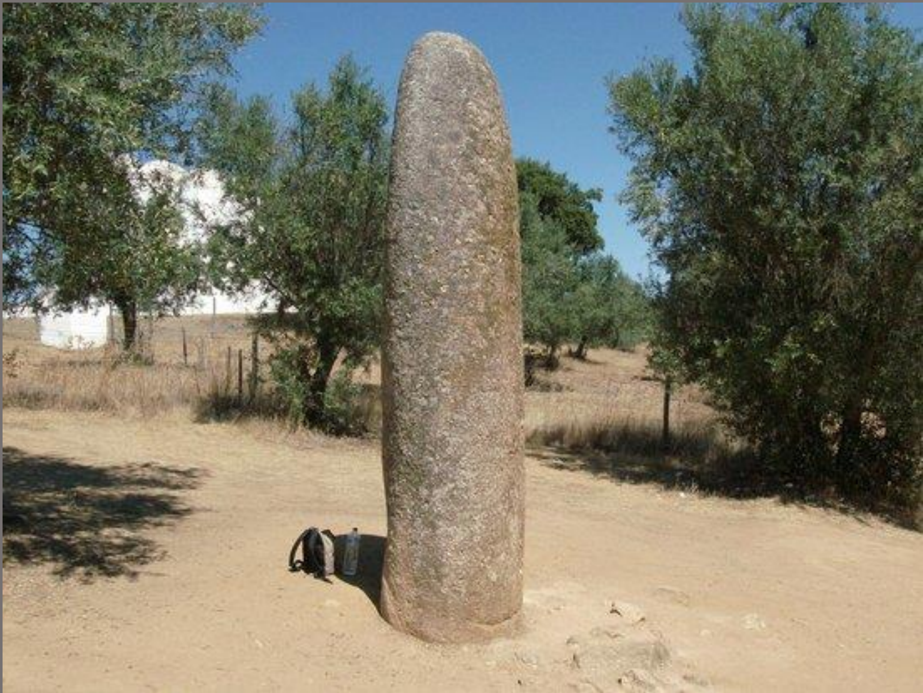
Almendres, Évora, Portugal