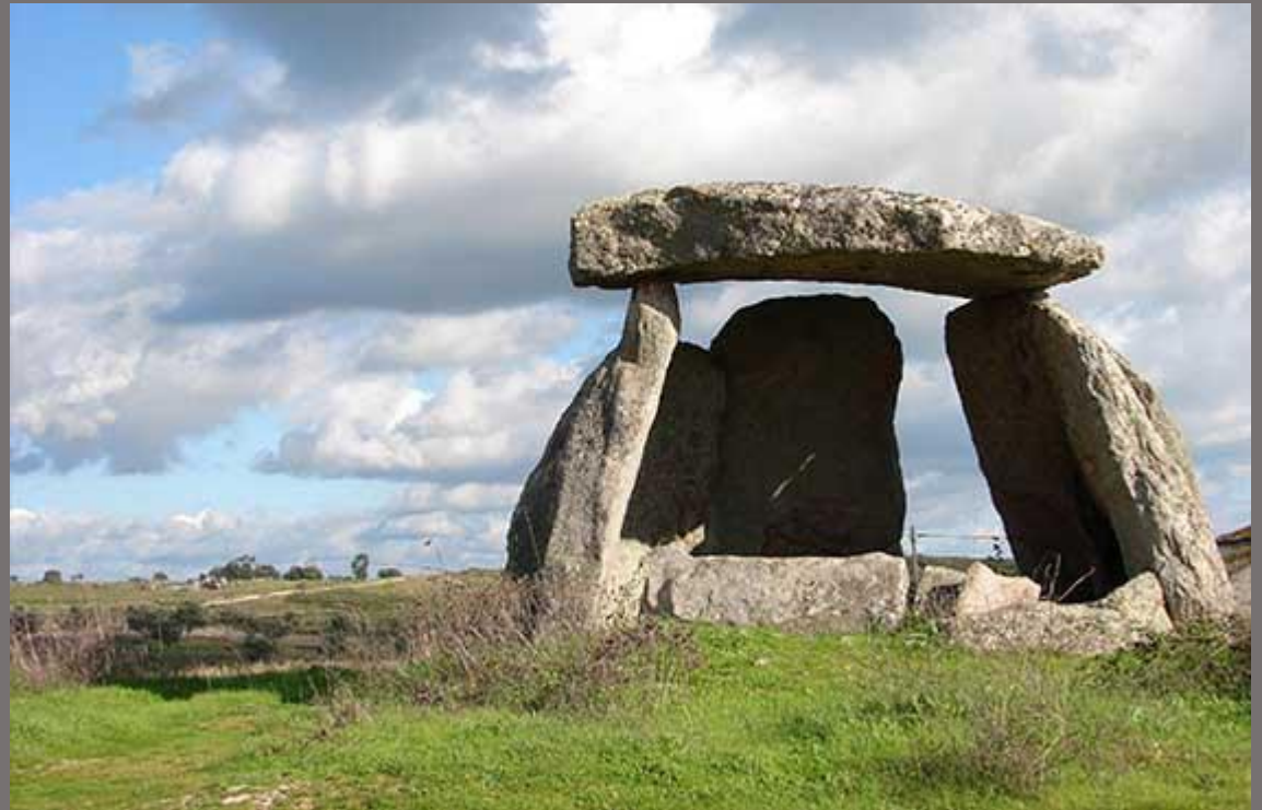
Anta Grande do Zambujeiro, em Portugal.

São considerados como Altares de sacrifício ou Túmulos