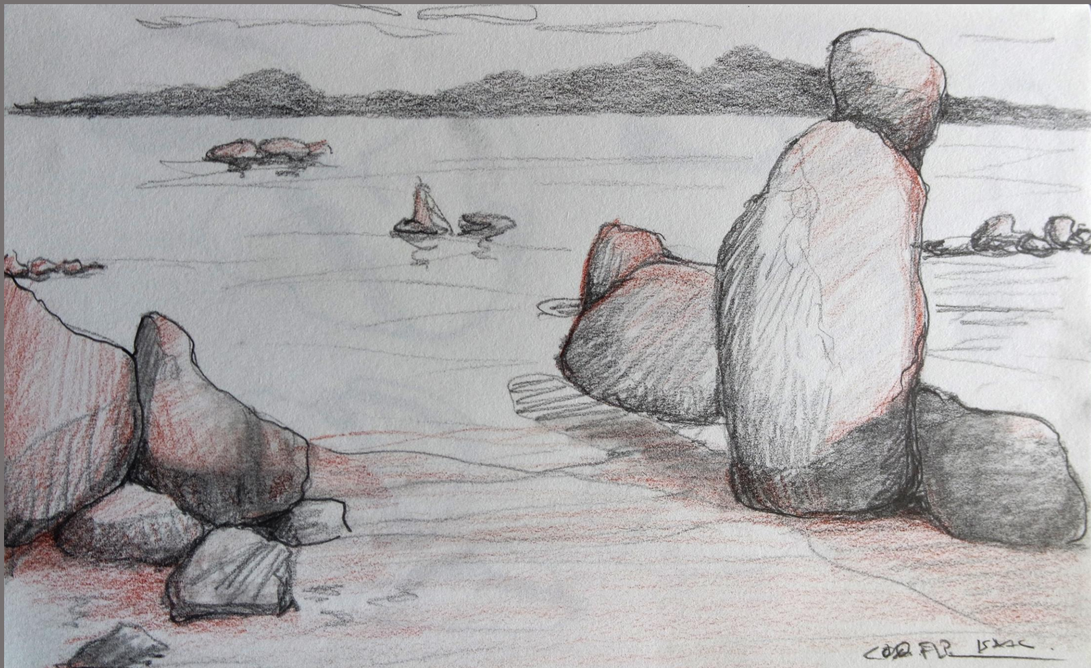
Praia de Coqueiros, Florianópolis, SC.