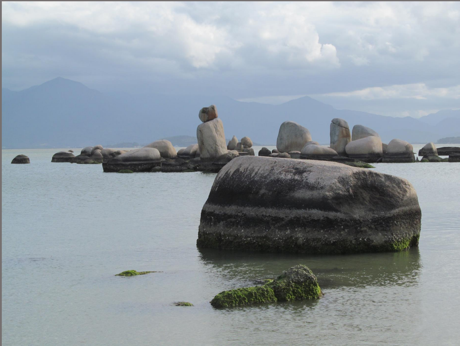
Praia de Coqueiros, Florianópolis, SC.