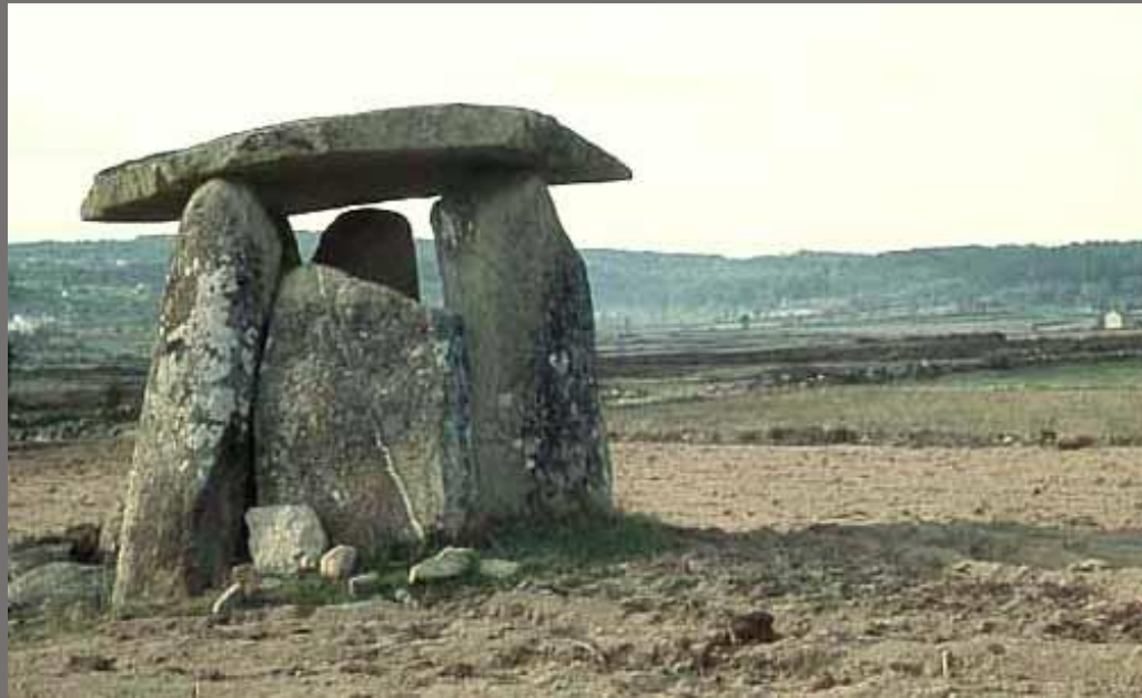
Túmulo megalítico em Corgas de Matança, Fornos de Algodres, Portugal.