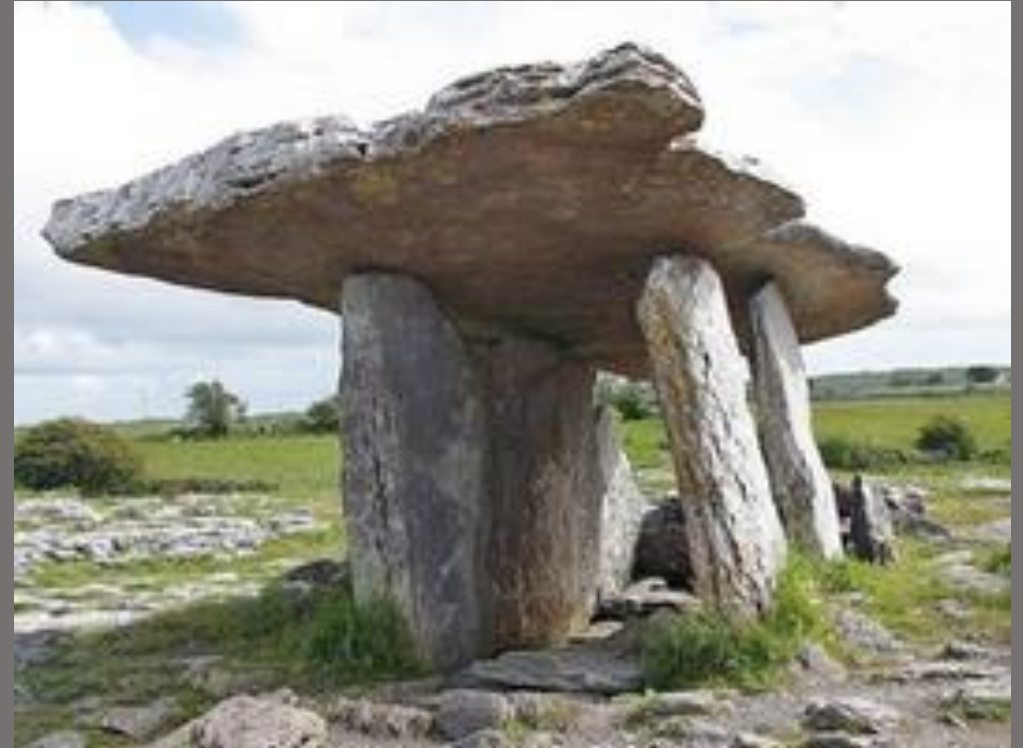
Poulnabrone Dolmen, County Clare, Irlanda.