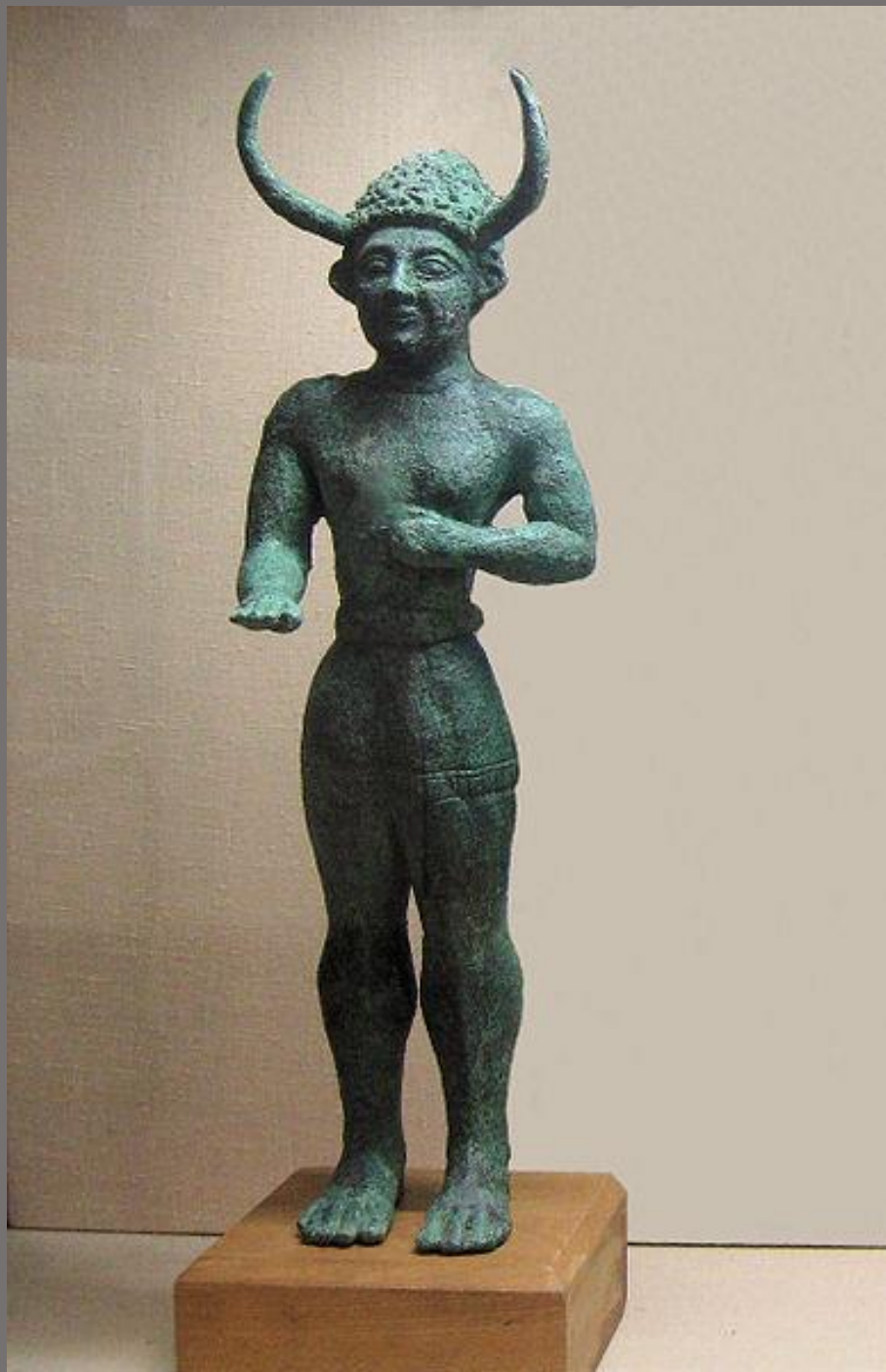
HISTÓRIA DA ARTE