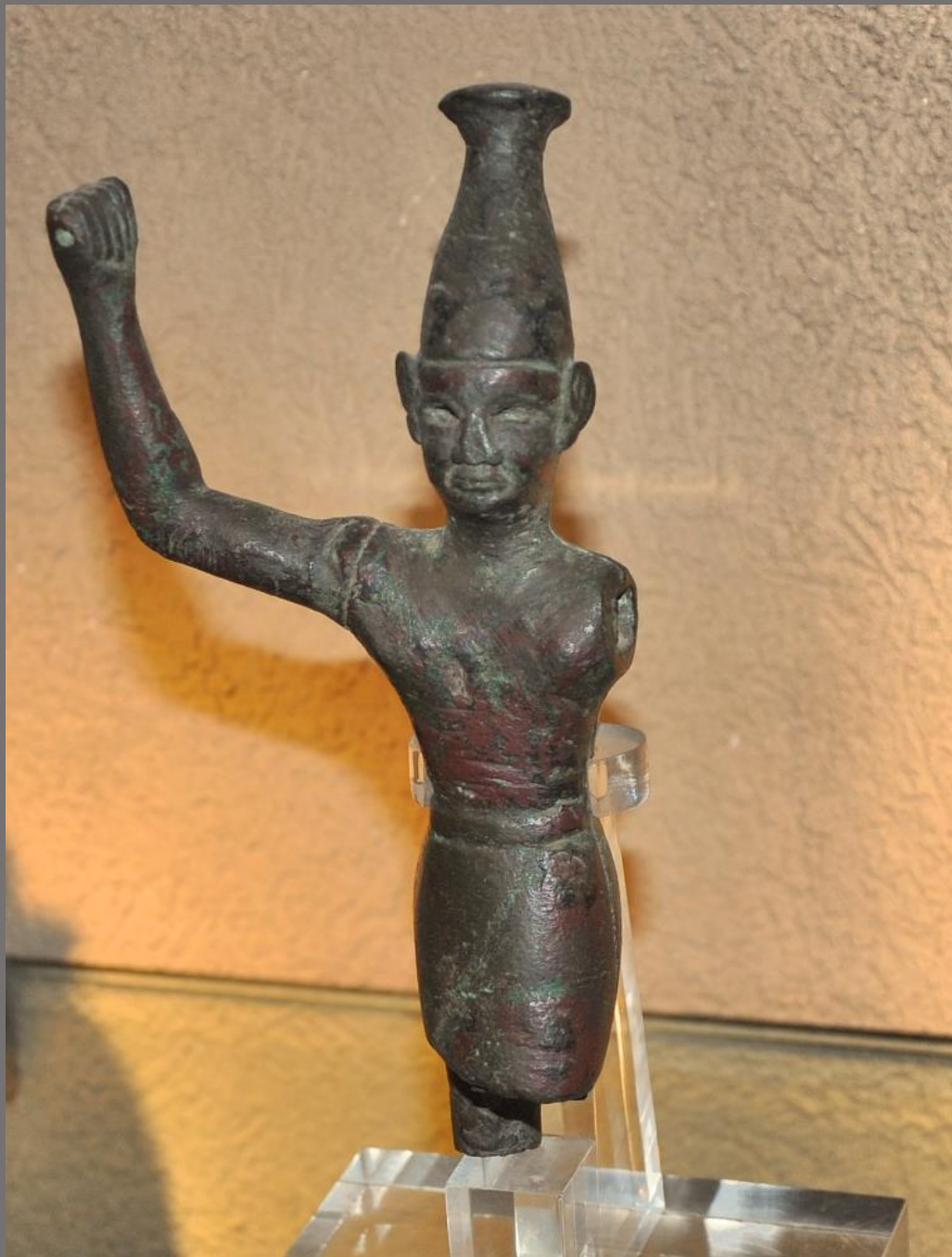
HISTÓRIA DA ARTE