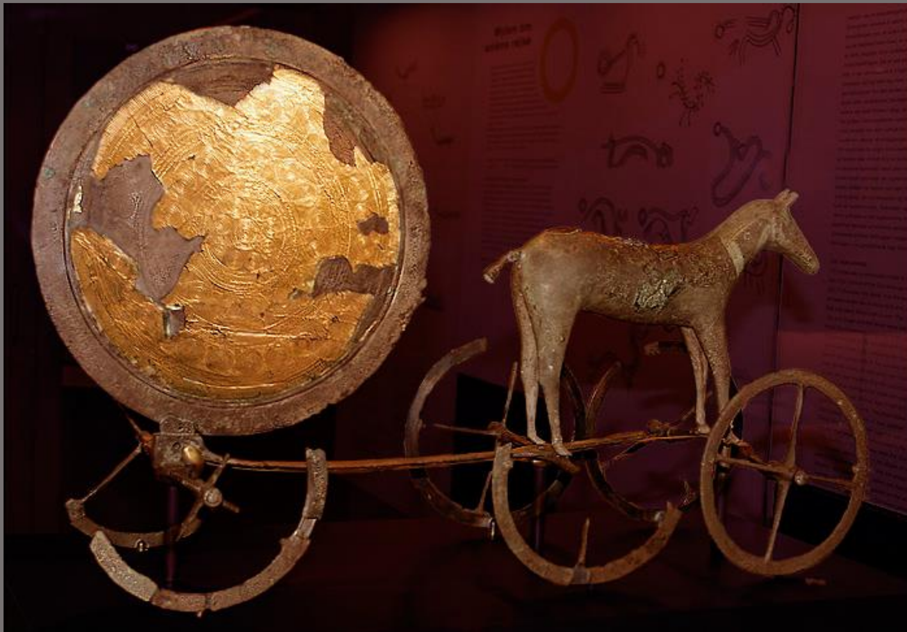
Carruagem de guerra de Trundholm (Dinamarca), século V-IV a.C.