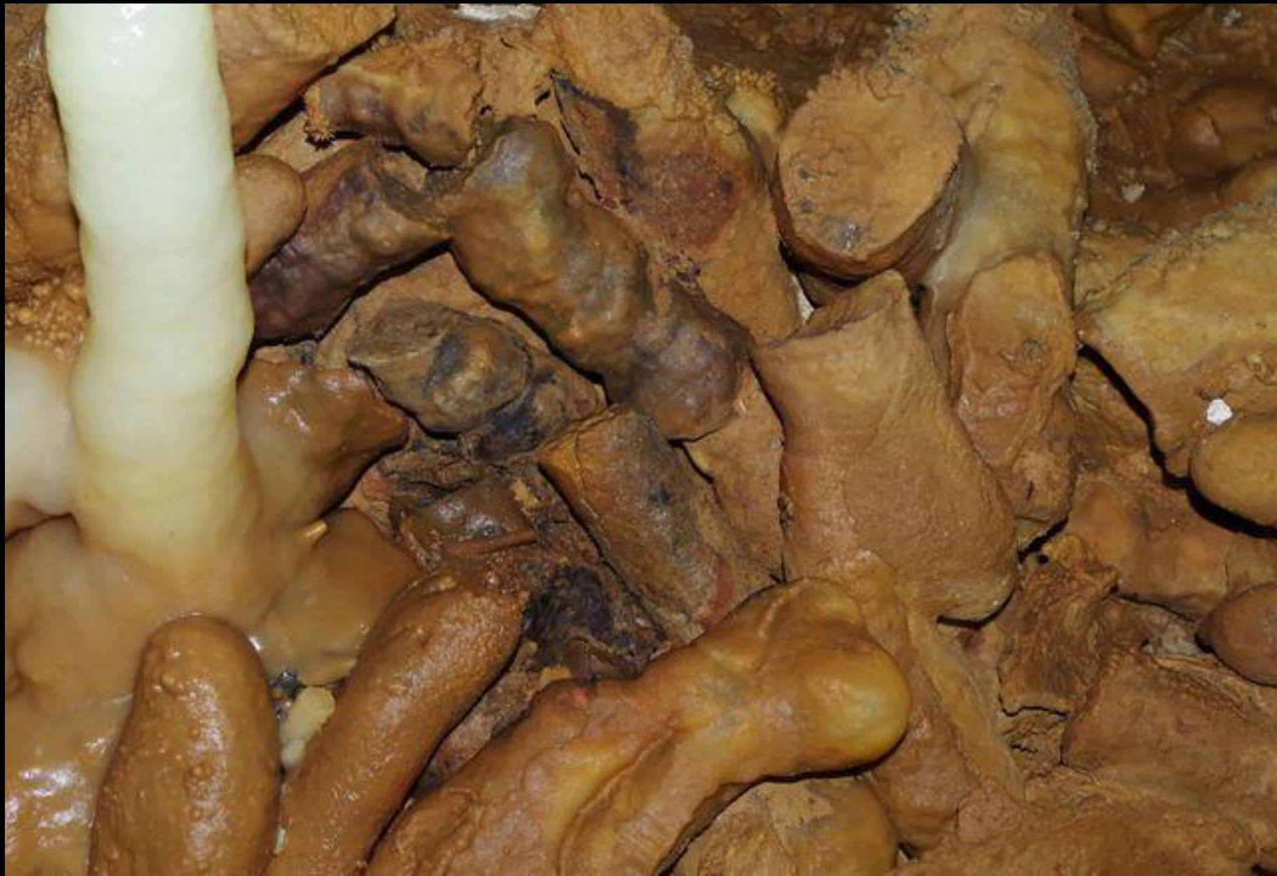
Detalhe de estalagmites com vestígios de carbonização.