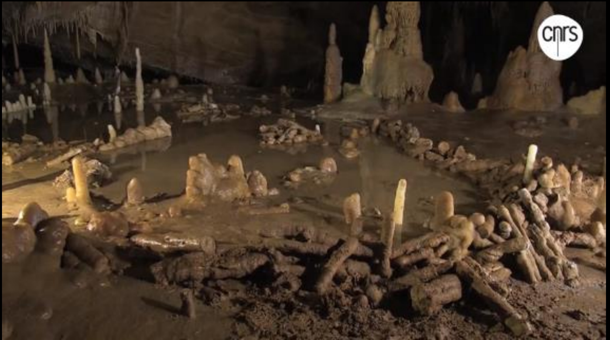
Sala na caverna Bruniquet, com estruturas datadas de aproximadamente 176.500 anos.