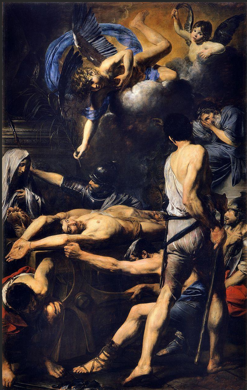
Martírio de S. Martiniano, 1629.