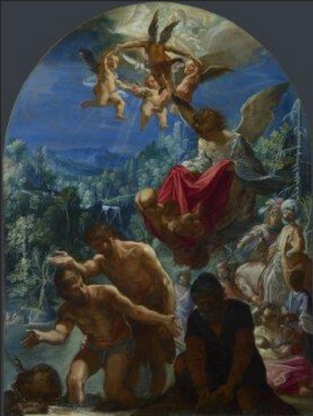
O batismo de Cristo, 1699.