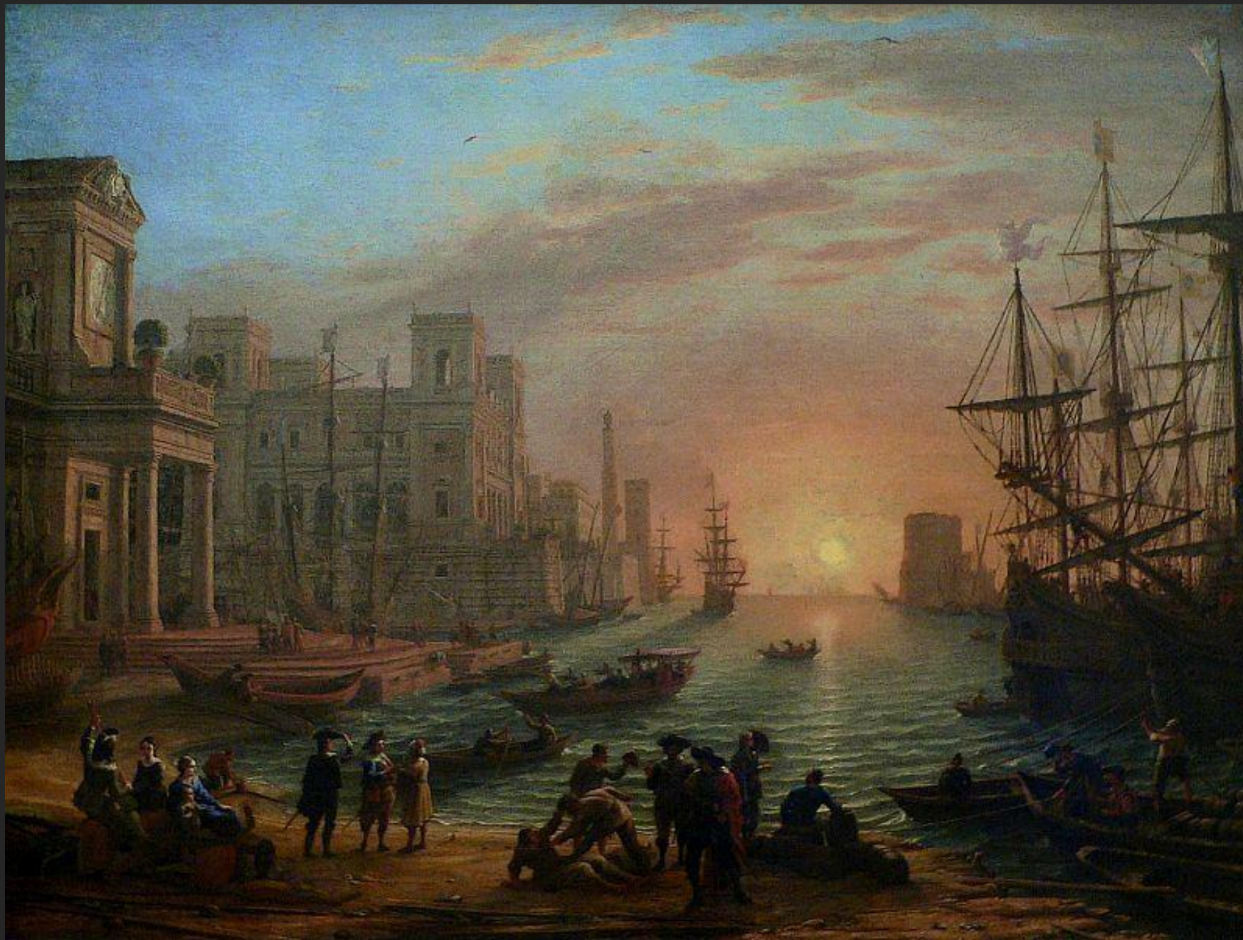
Porto marítimo no do sol, 1639.