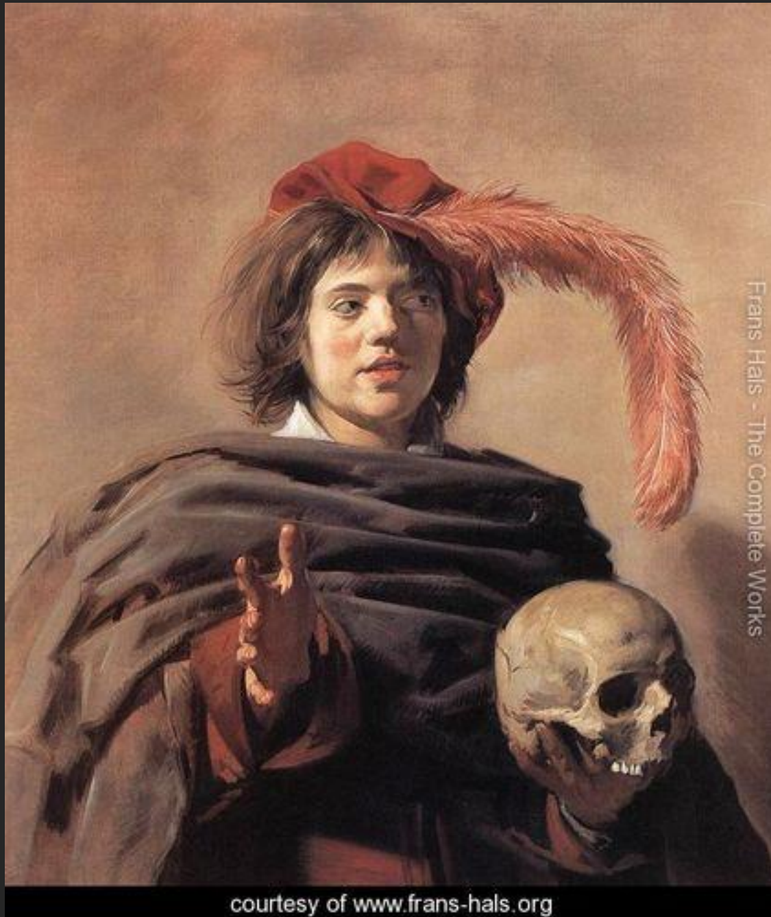
Jovem com caveira, 1626-28.