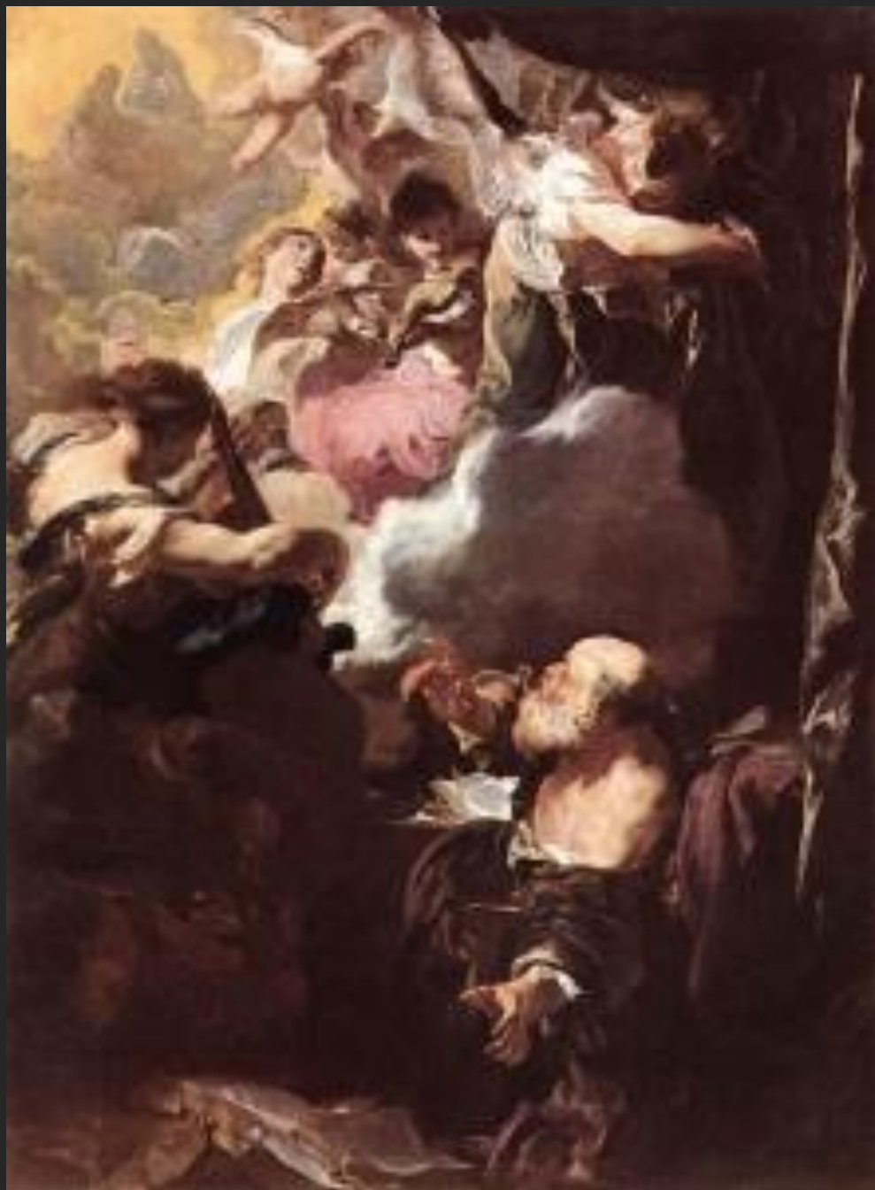
Extase de S. Paulo, 1628-29.