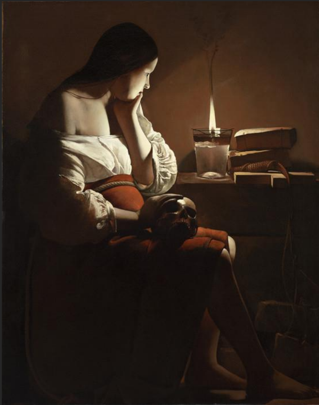
Madalena diante da chama, 1640.