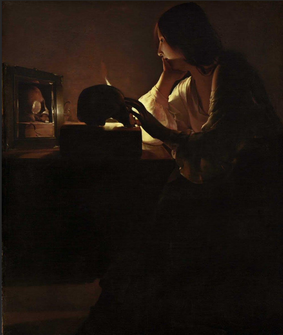
Madalena arrependida, 1630.