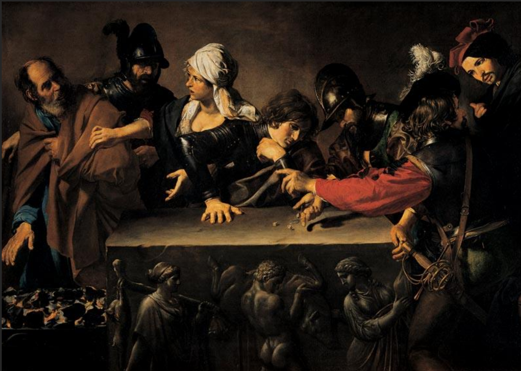
A negação de Pedro, 16...