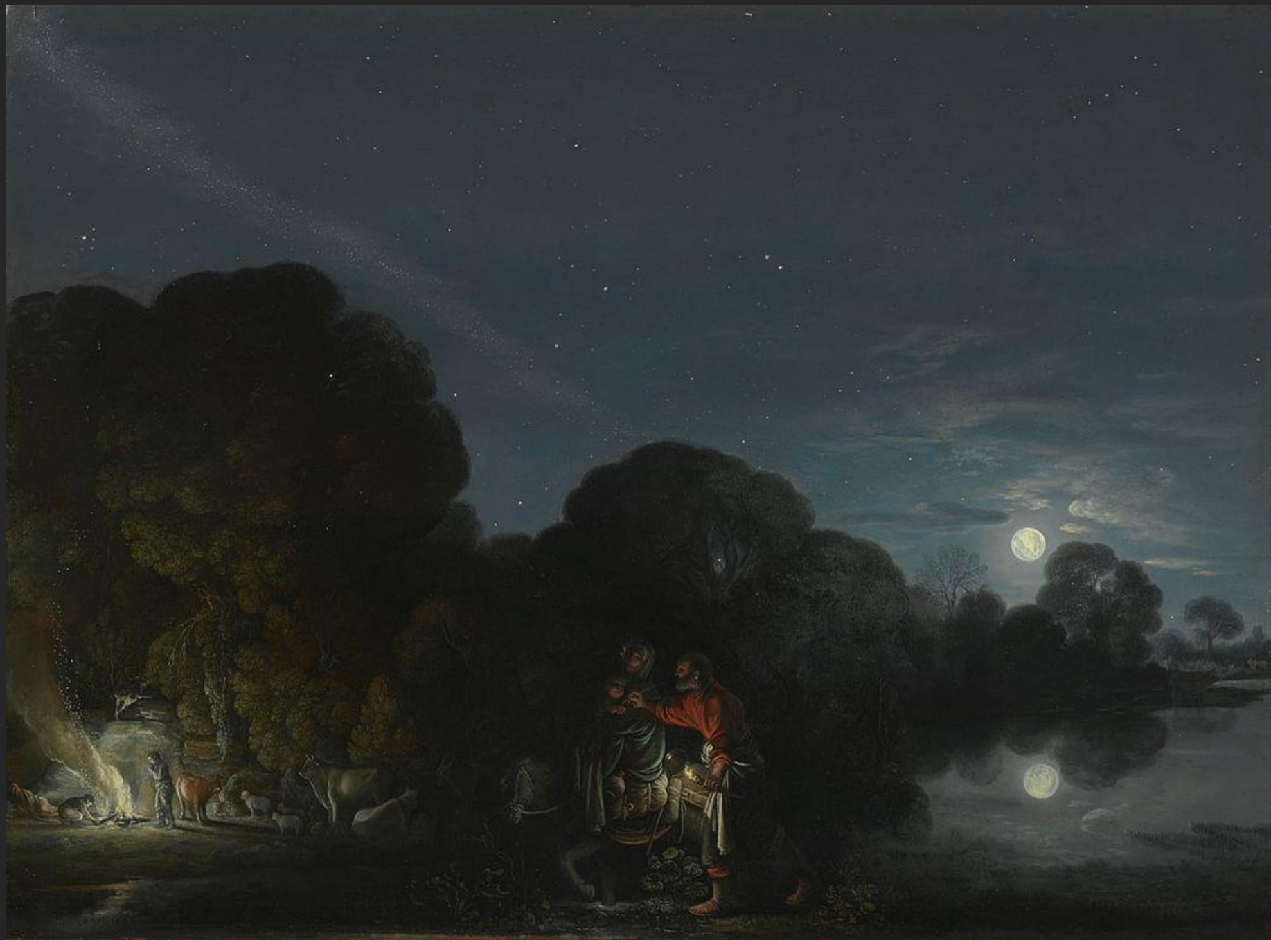
Descanso na fuga para o Egito, 1608.