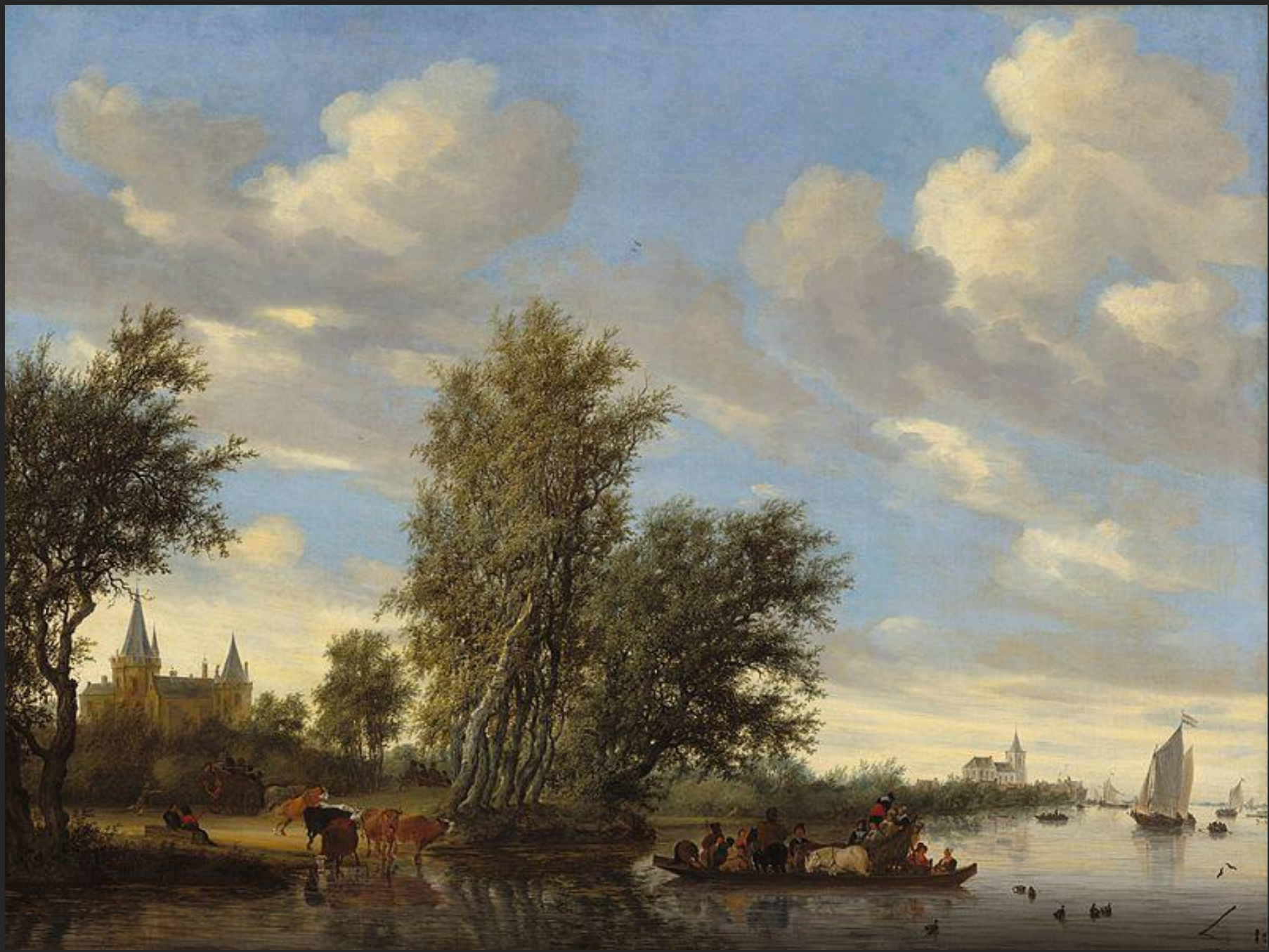
Balsa no rio, 1649.