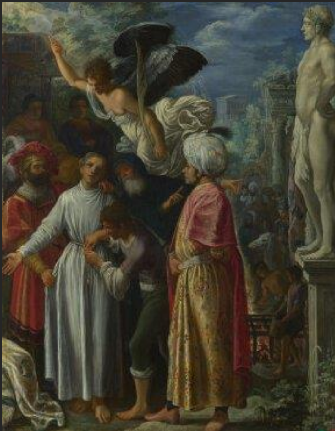
Preparação do martírio de S. Lourenço, 1600-01.