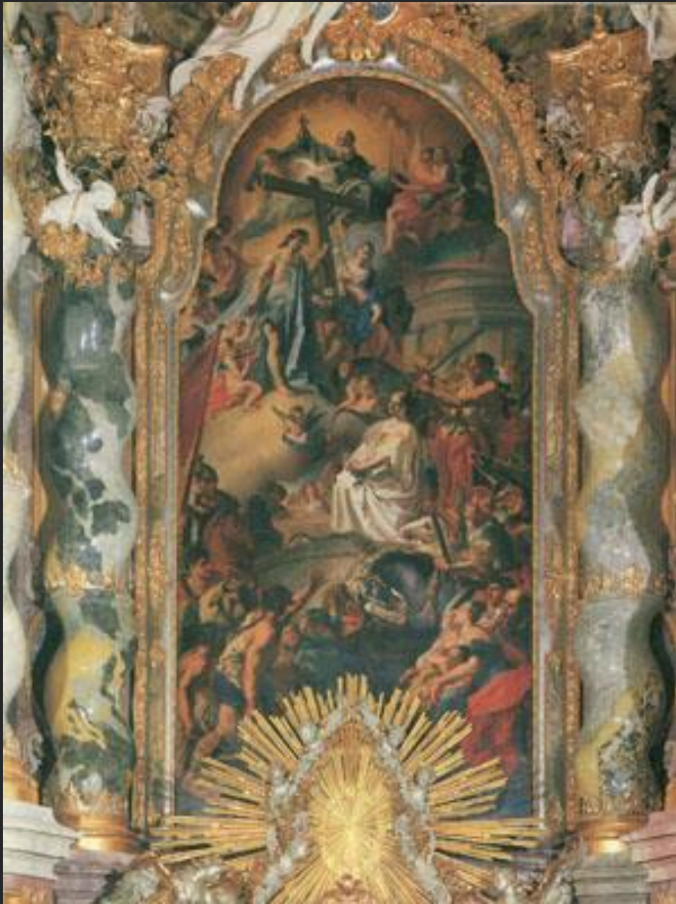
Sta. Margareth, 17...