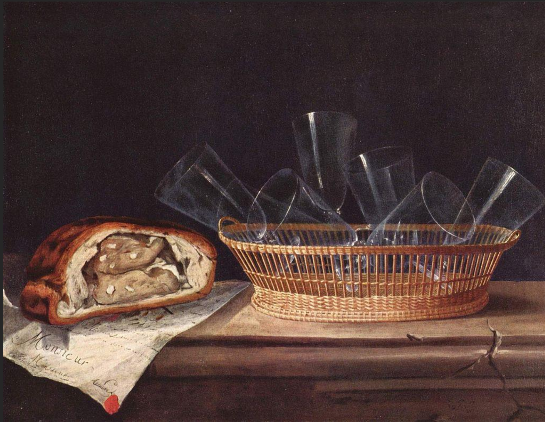
Natureza morta com copos, 1640.