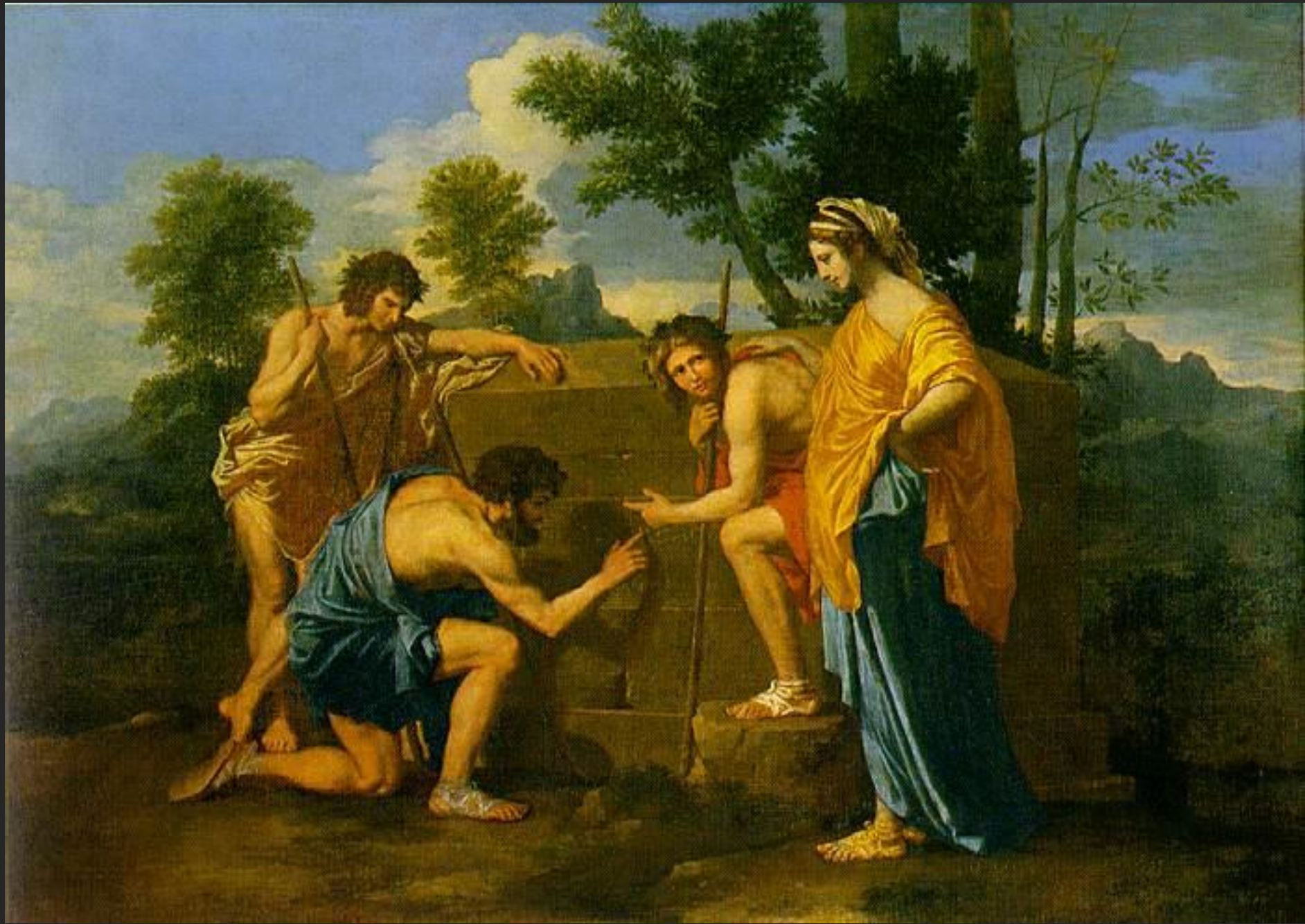
Os pastores de Arcádia, 1630.