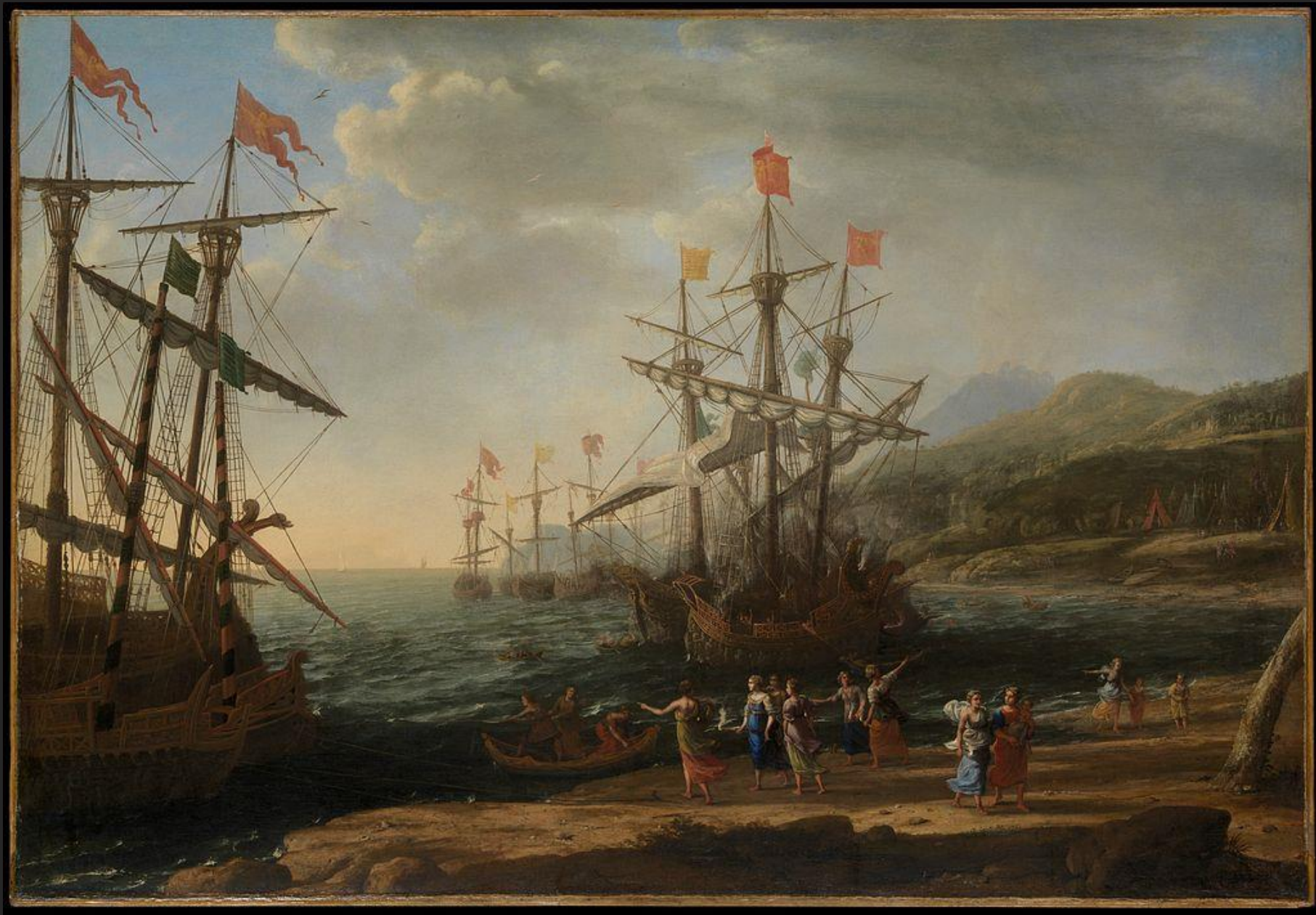
Mulheres troianas, 1643.