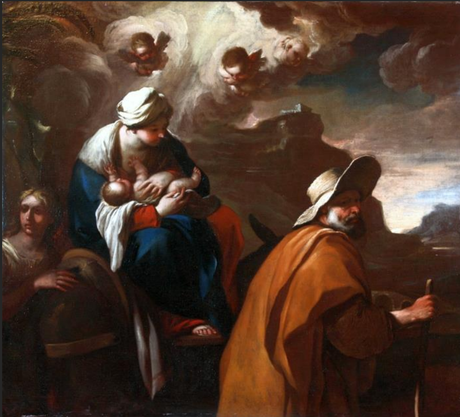
Fuga para o Egito, 16...