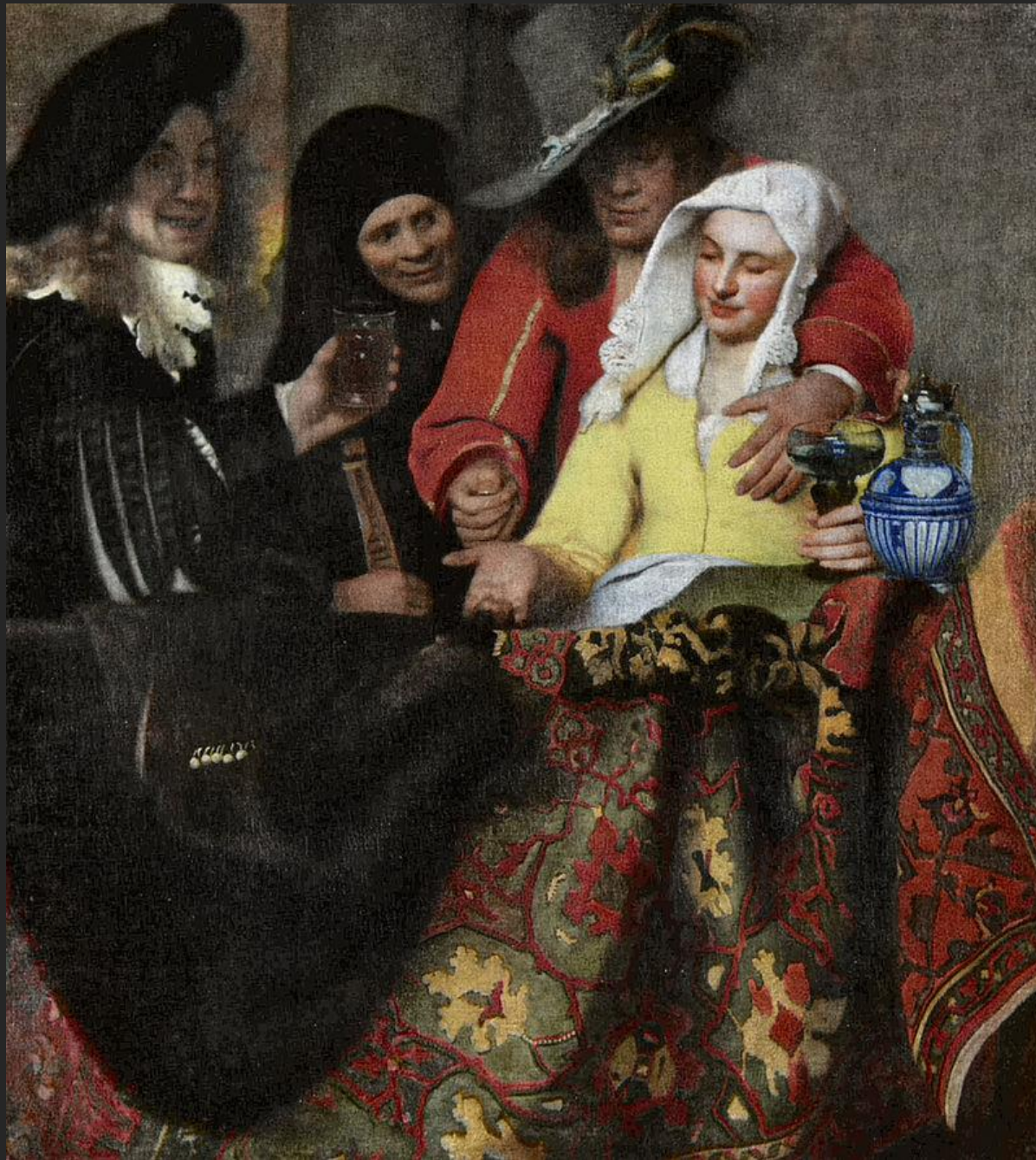
A alcoviteira, 1656.