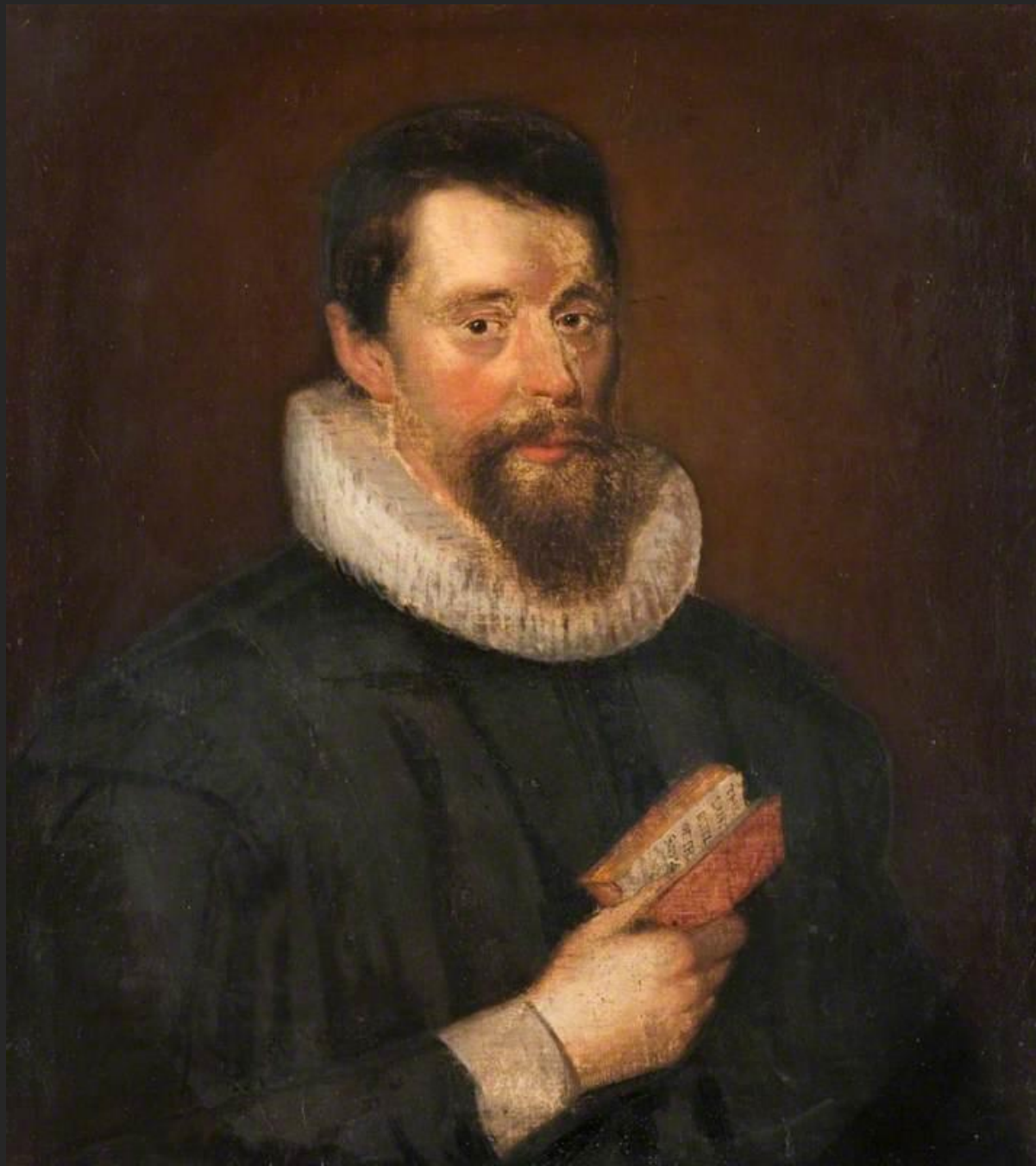
Zachari Boyd, 1653.