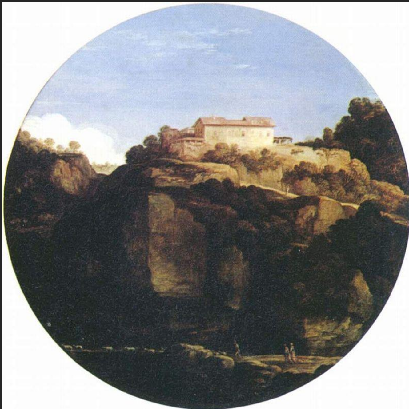
Tondo com paisagem, 16...