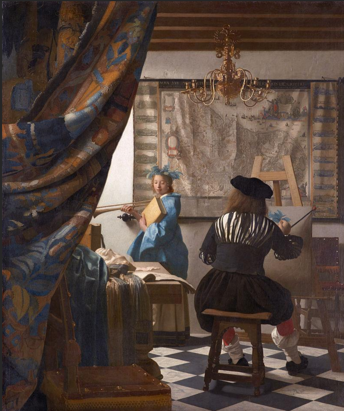
Alegoria à janela, 1666-67.