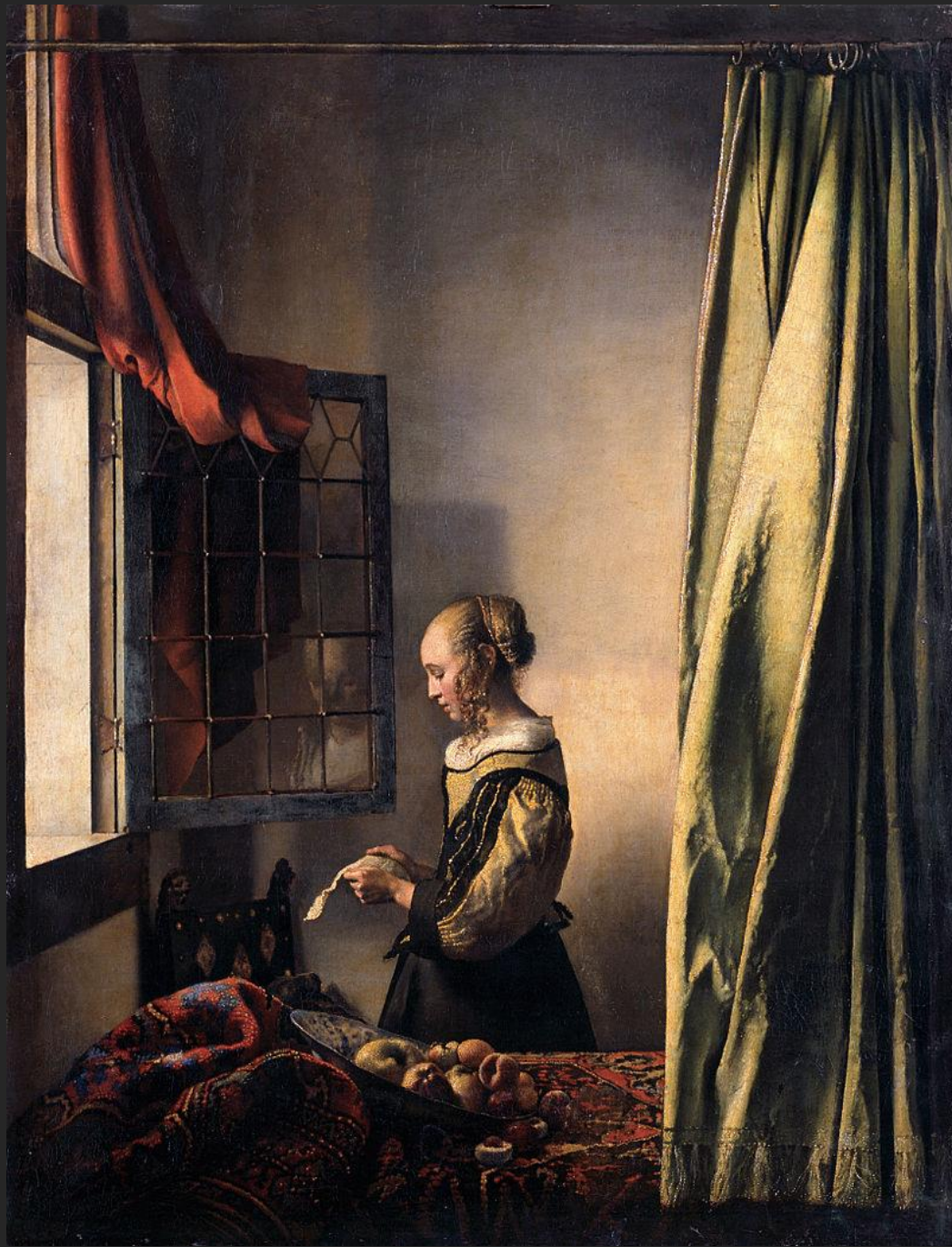
Leitura à janela, 1657-59.