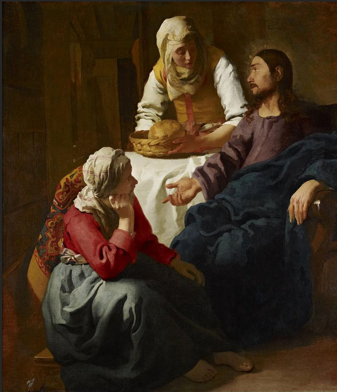
Cristo na casa de Marta e Maria, 1654-55.