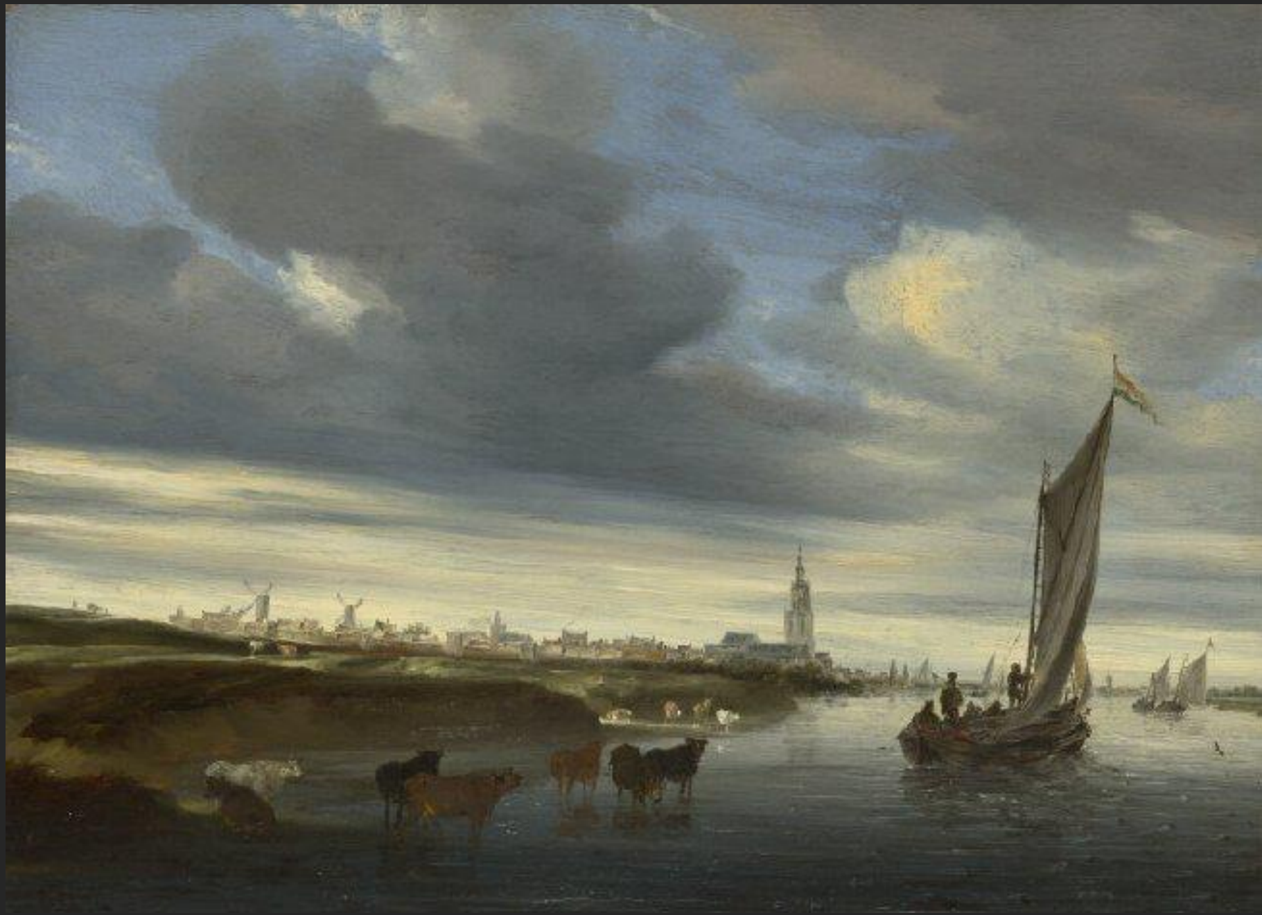
Vista do rio Renen, 1648.