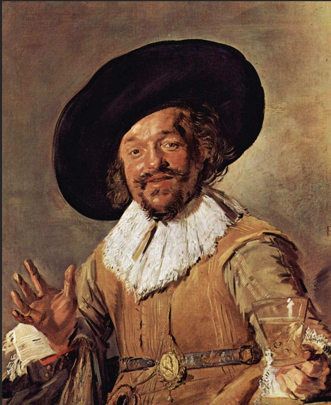
O bebedor de cerveja, 1628-30.