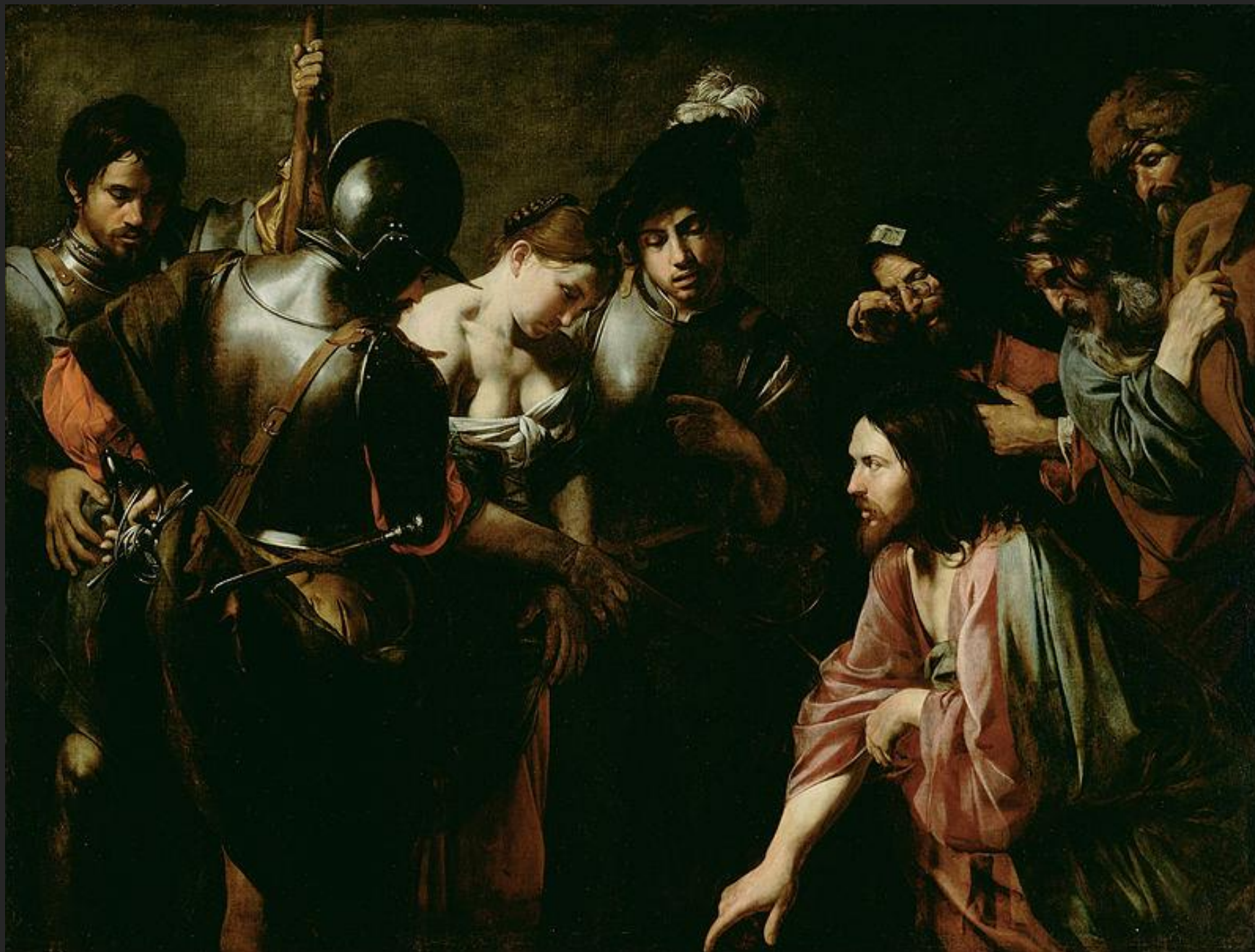
Cristo e as adúlteras, 16...