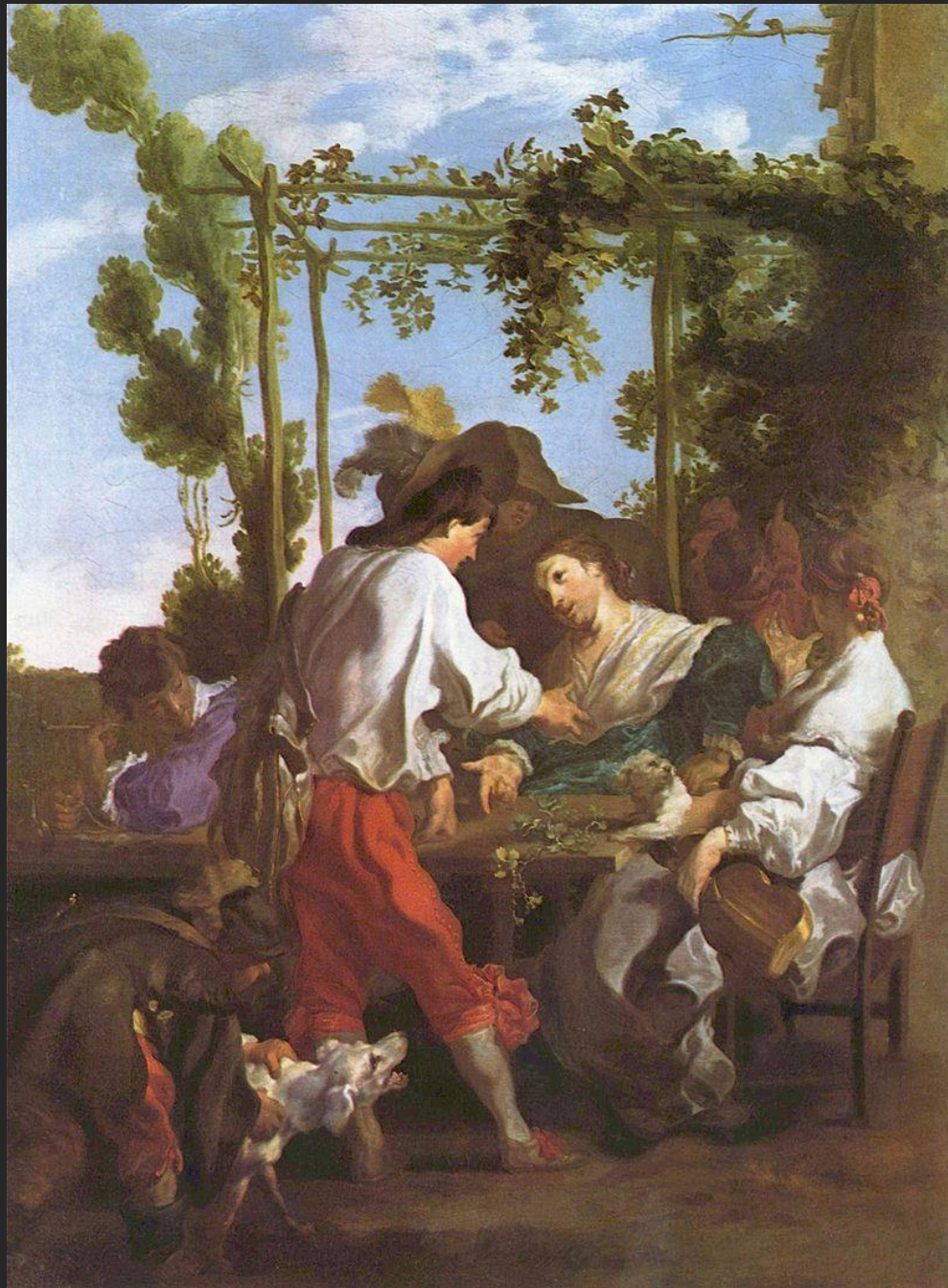
Jogo de Mora, 1622.