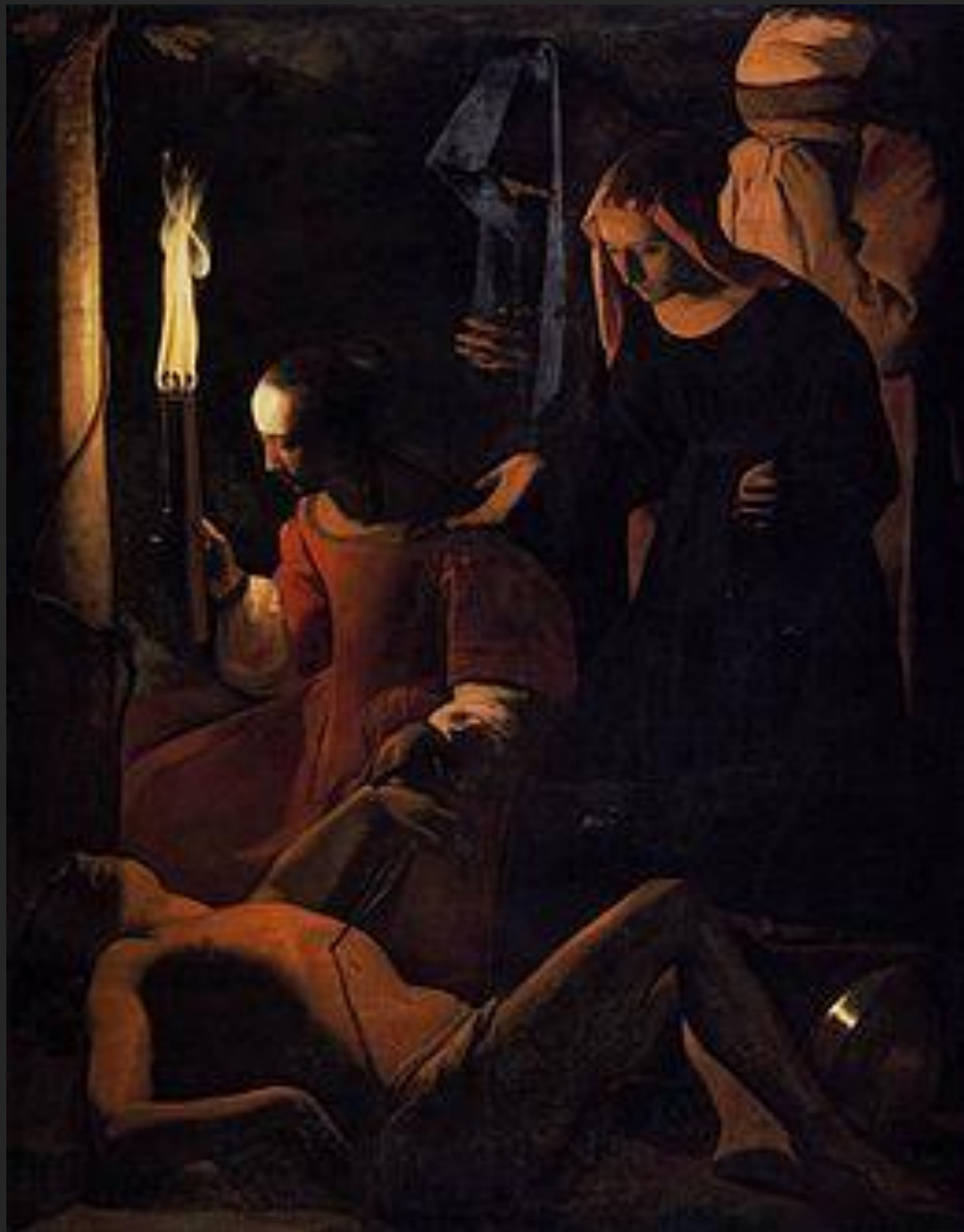
S. Sebastião atendido por Sta. Irene,