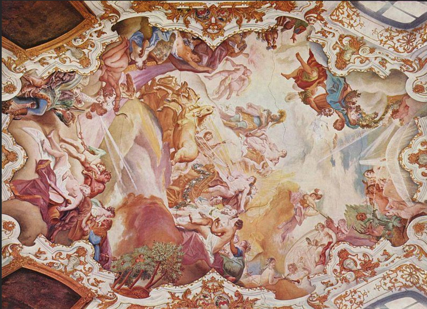
O triunfo de Apolo, 1730.