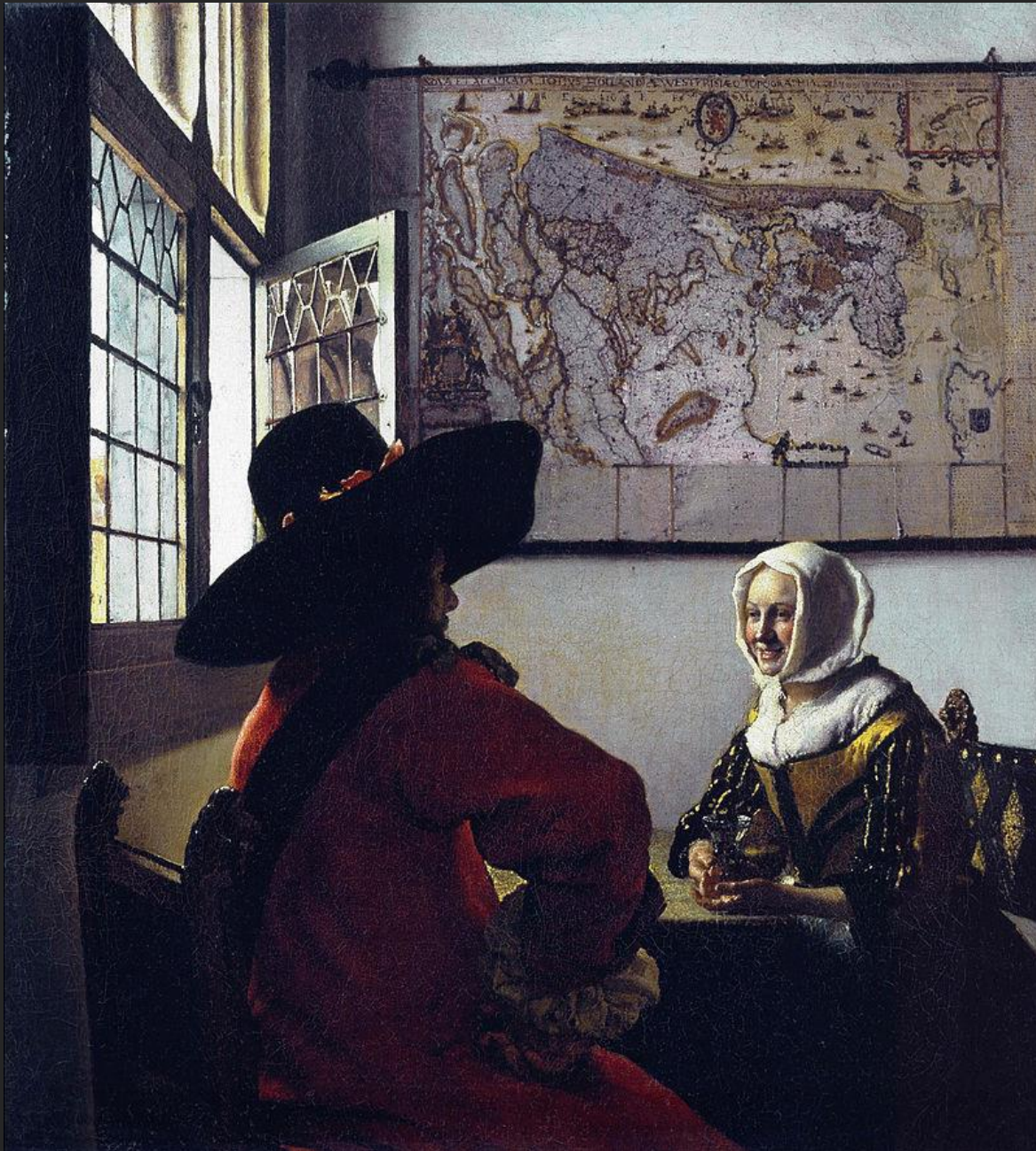
O oficial e a moça sorridente, 1658.