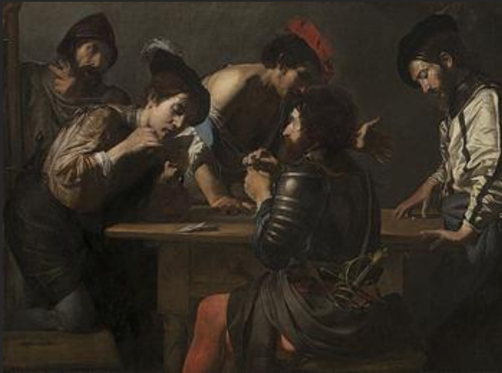
Soldados jogando cartas, 1618-20.