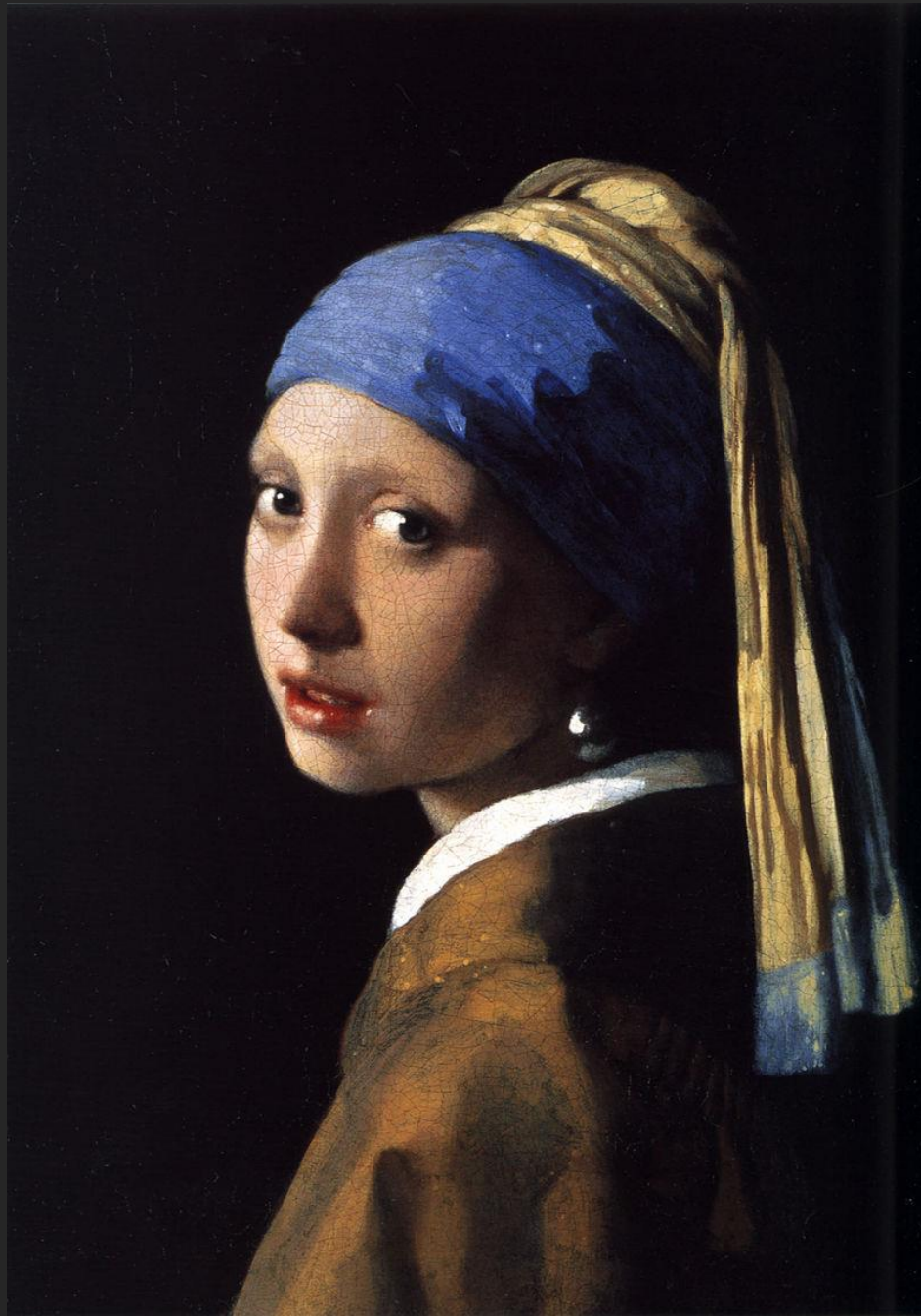
Moça com brinco de pérolas, 1665-66.