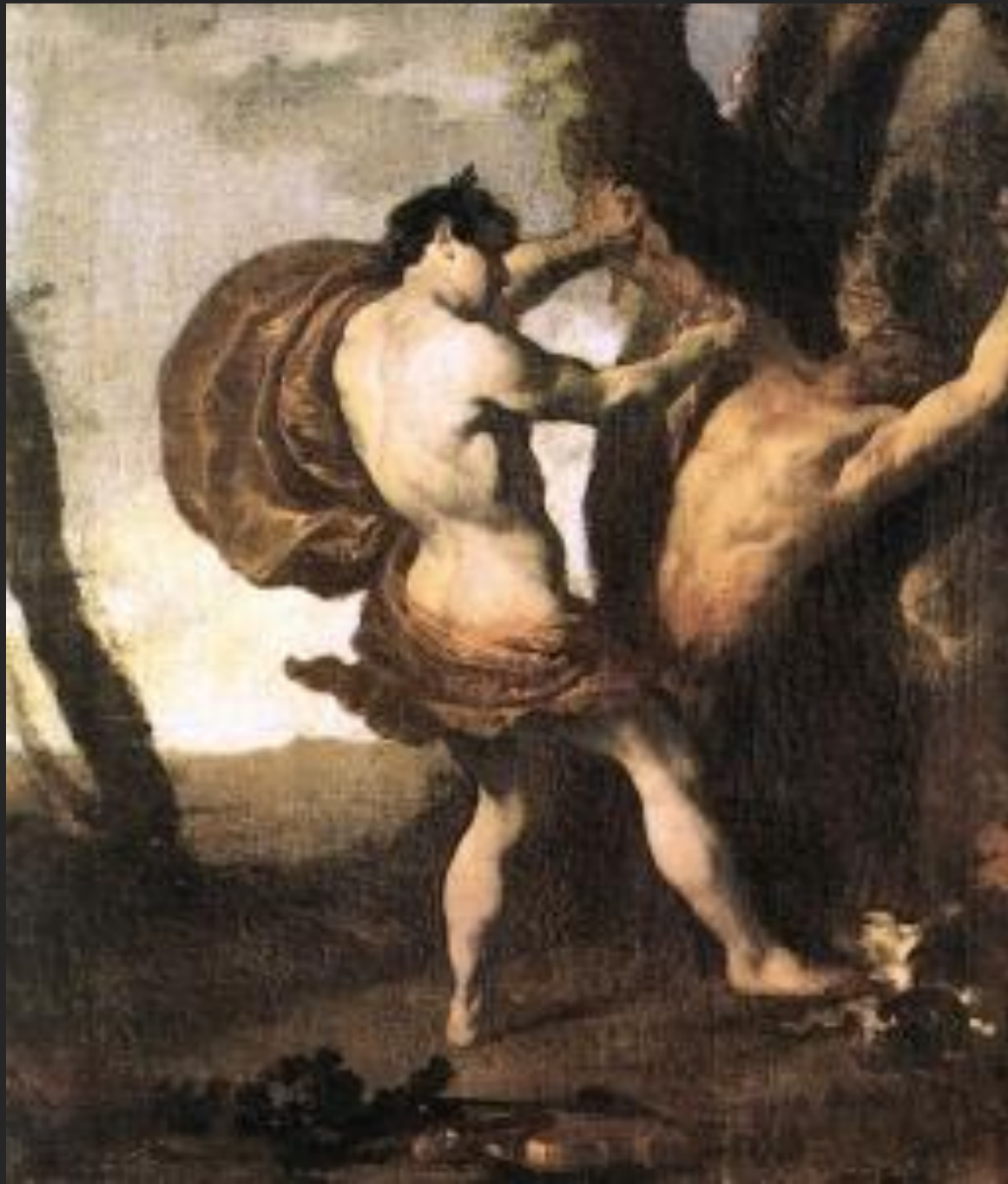
Apolo e Marsyas, 1627.