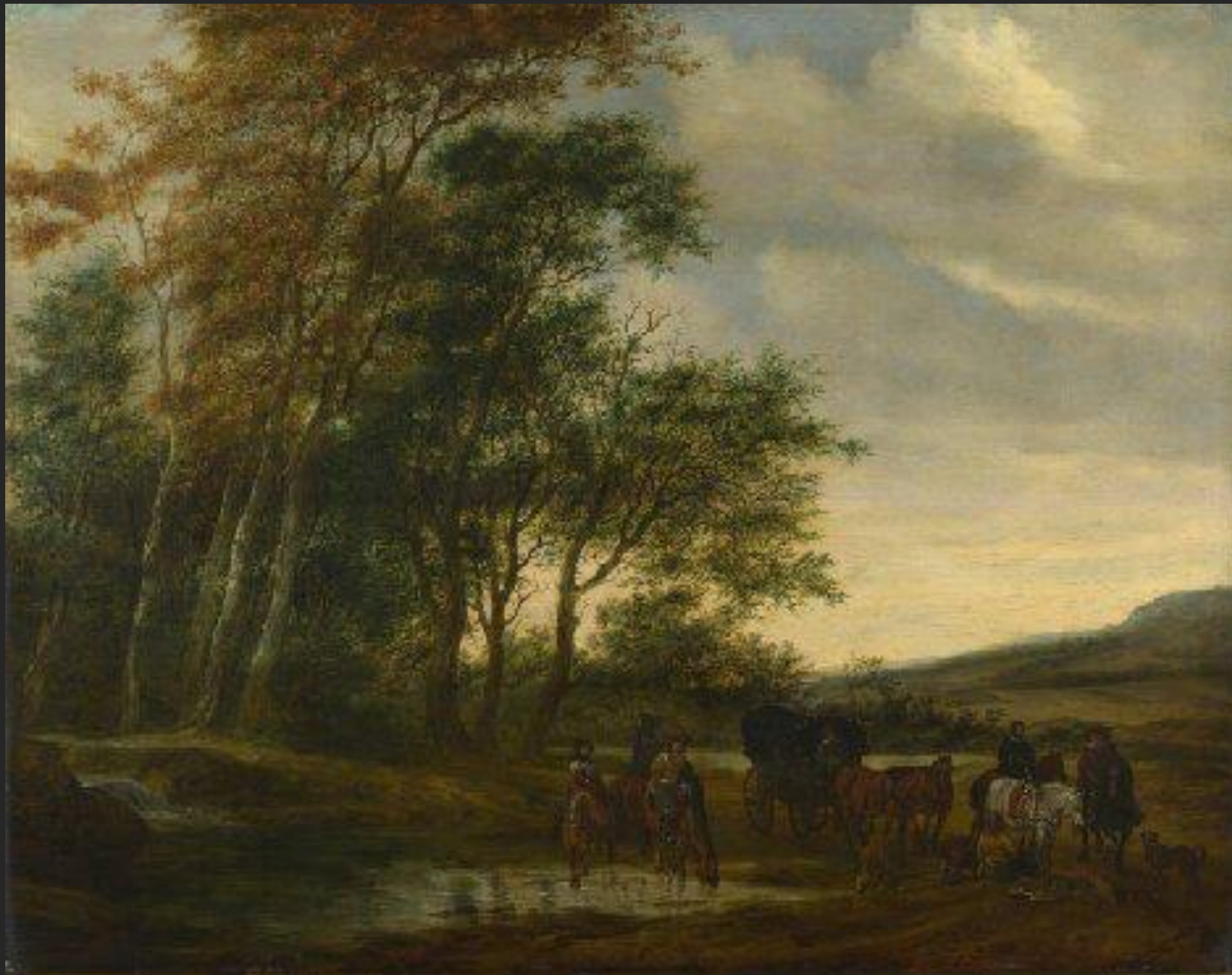
Paisagem com carruagem, 1659.