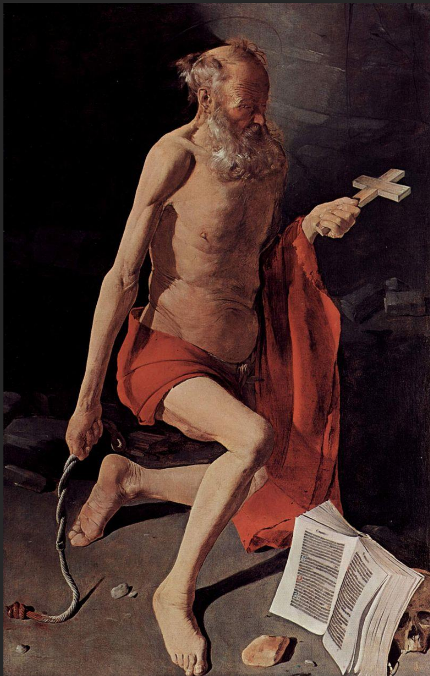
S. Gerônimo, 16...