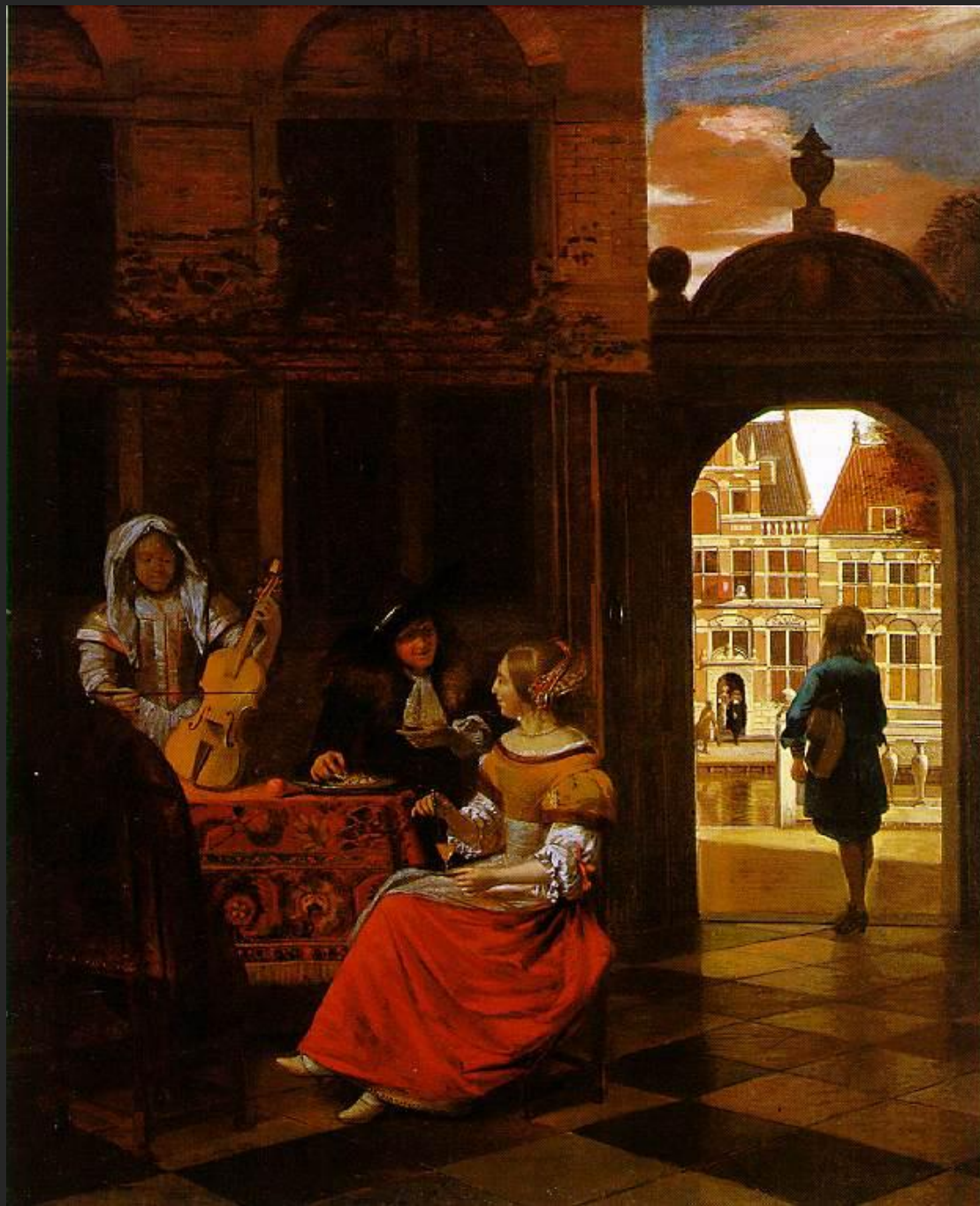
Festa musical no pátio, 1677.