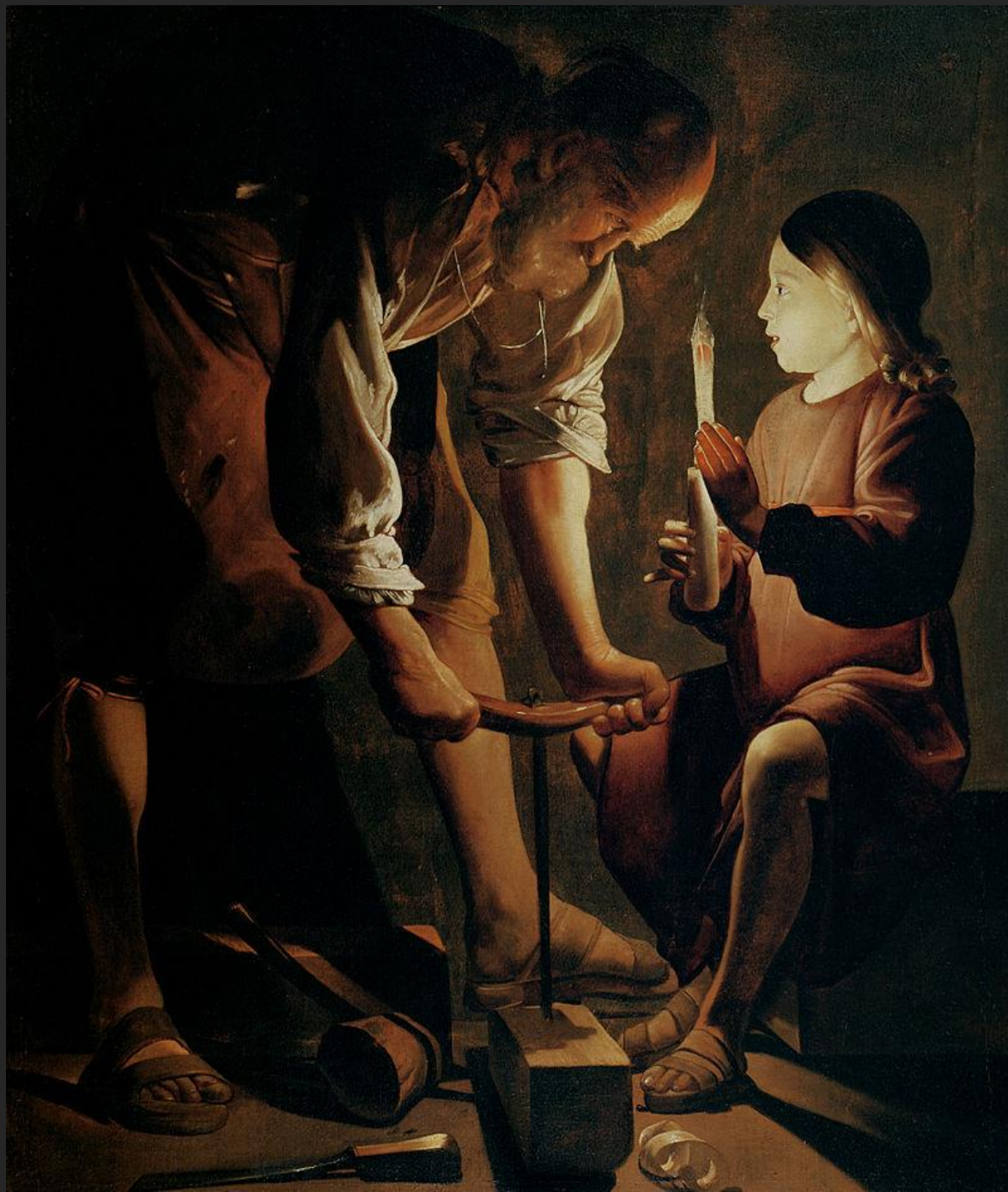
S. José carpinteiro, 1642.