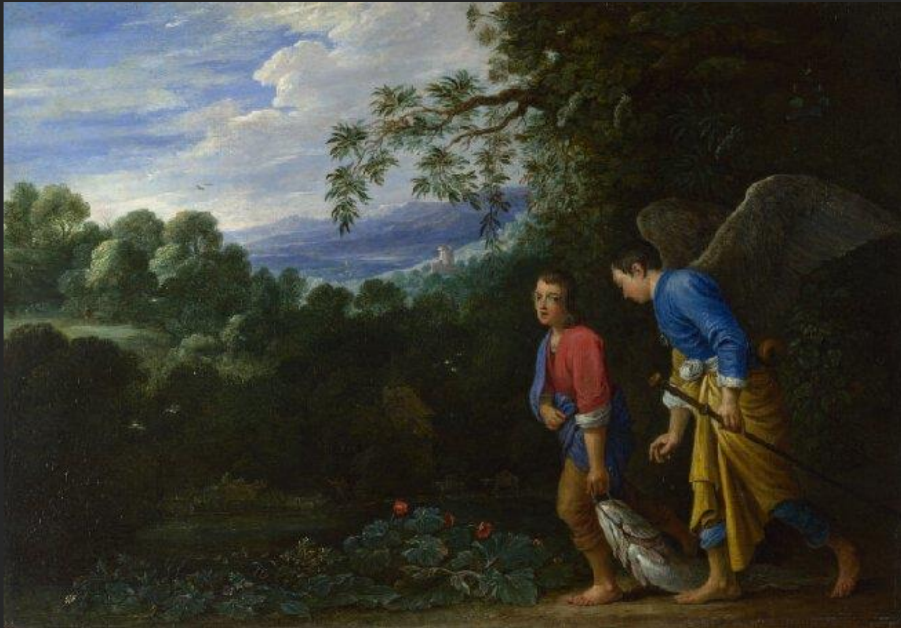
Tobias e o Arcanjo Gabriel,