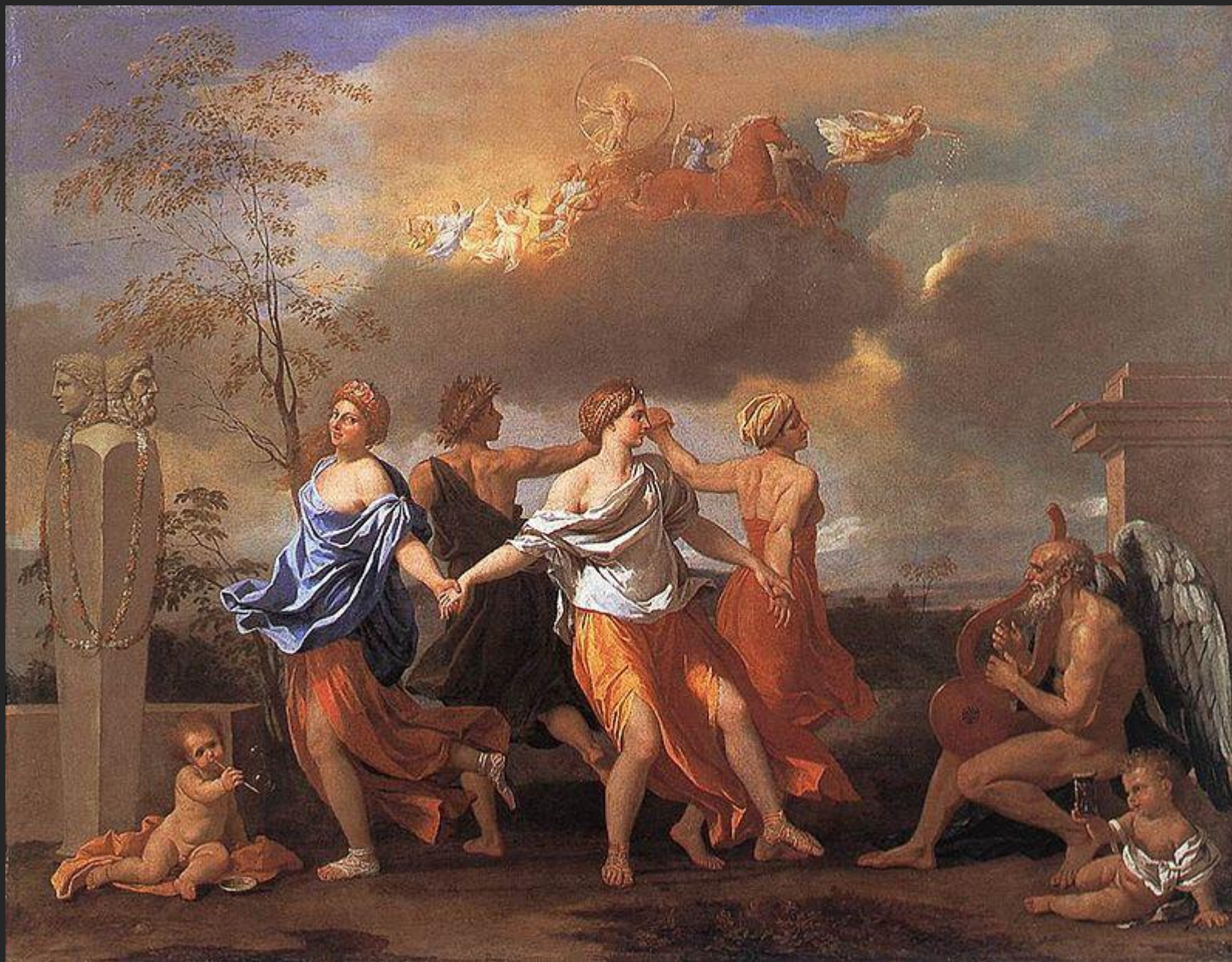
Uma dança para a música do tempo, 16...