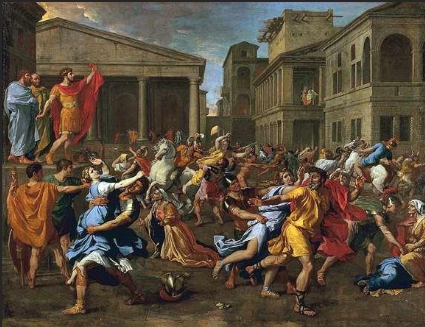
O rapto das Sabinas, 1637-38.