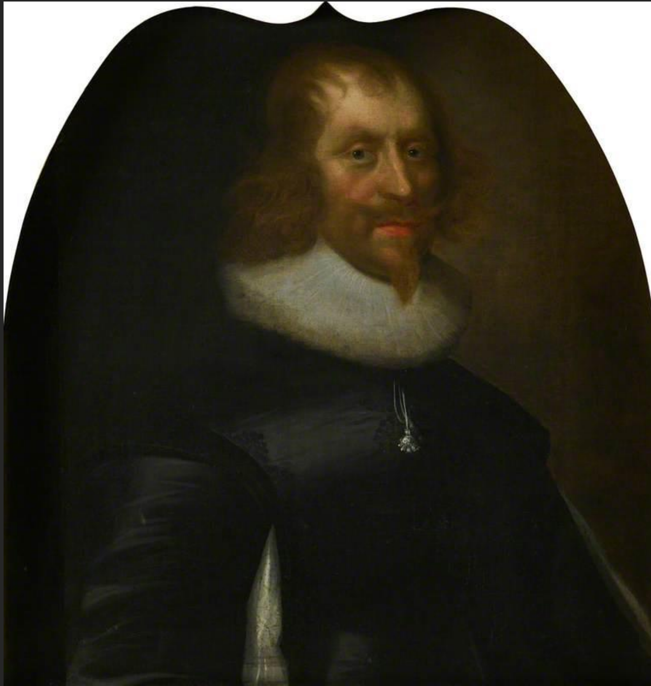
Sir Archibald Napier, 1645