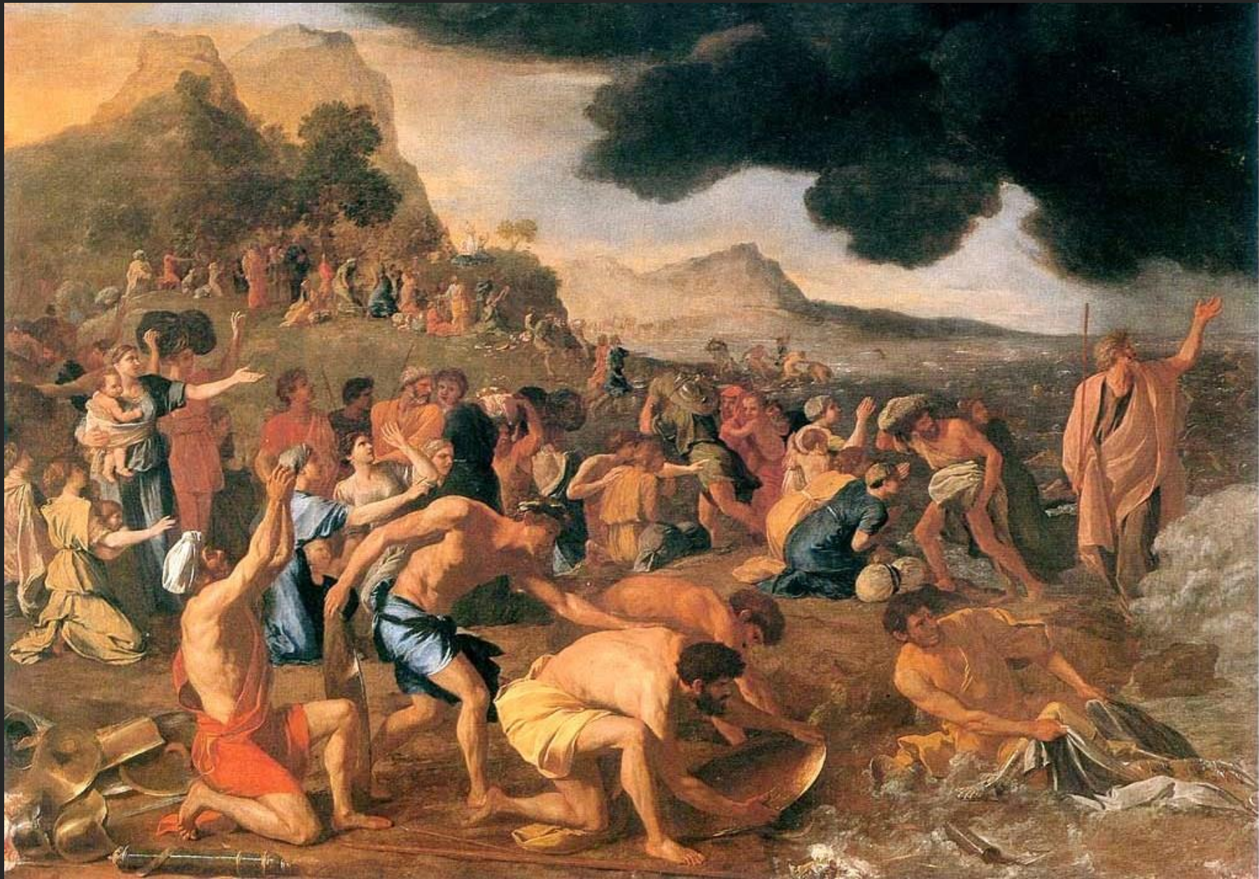
Travessia do Mar Vermelho, 16...