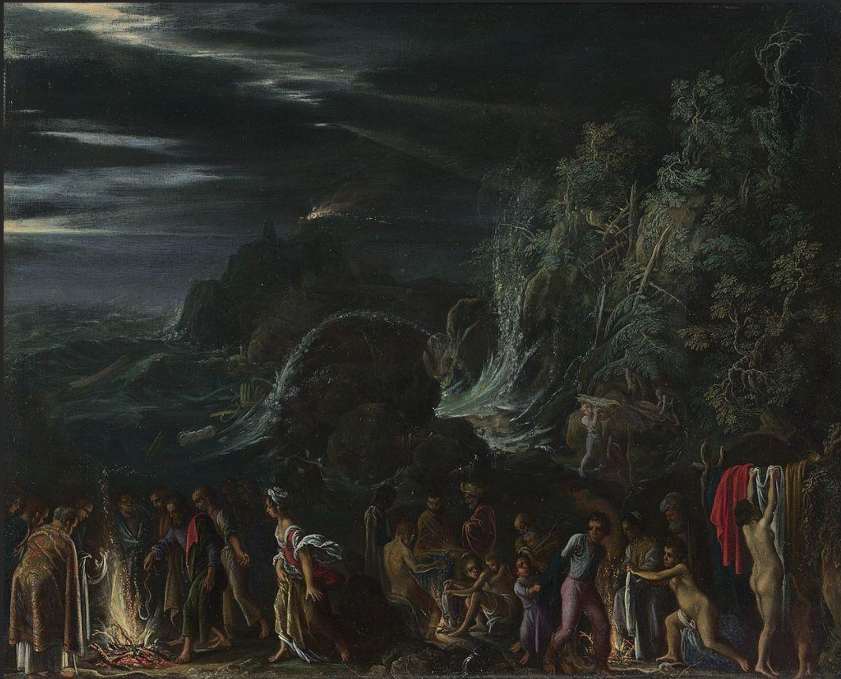
São Paulo em Malta, 1600.