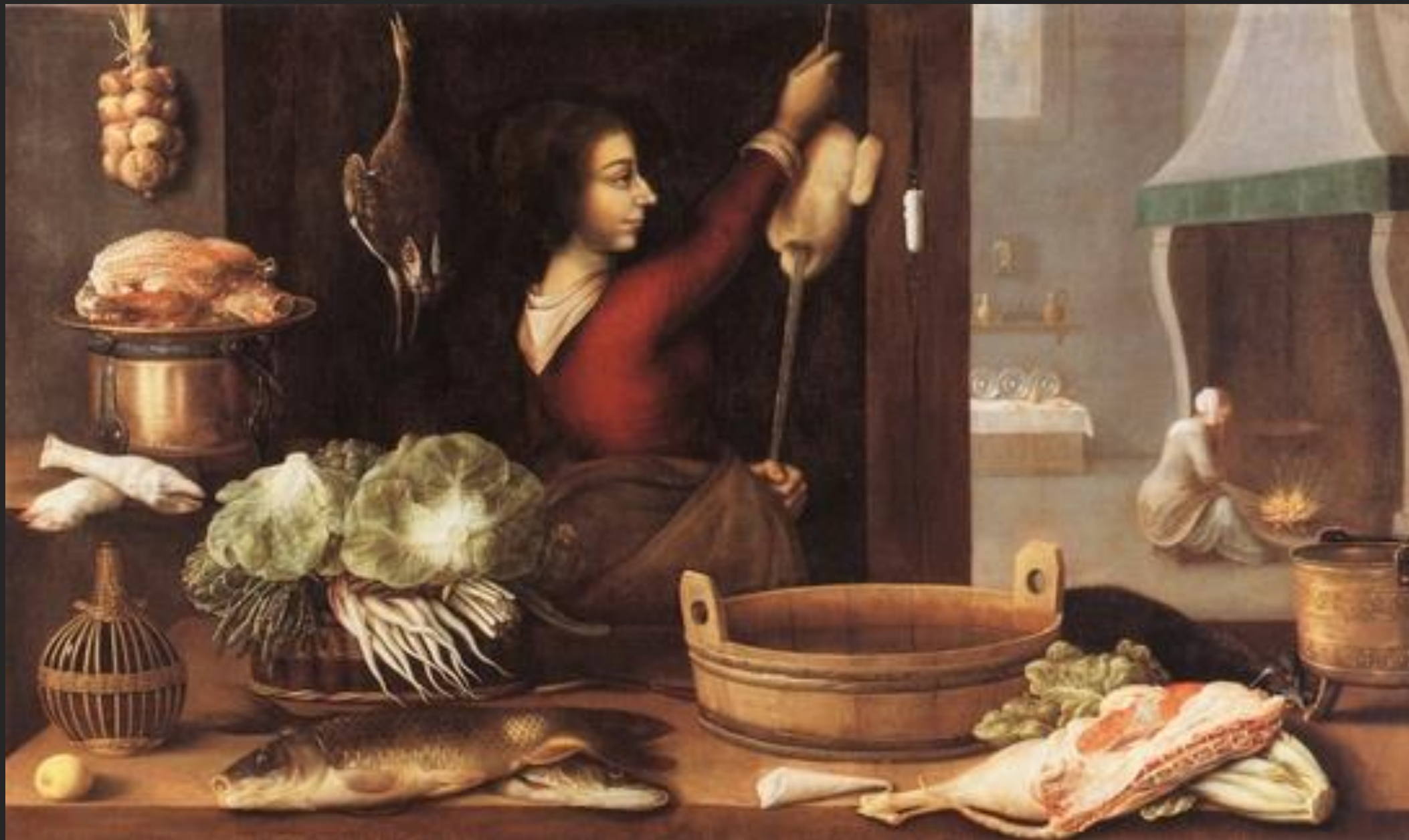
The four elements or Winter) ca 1633