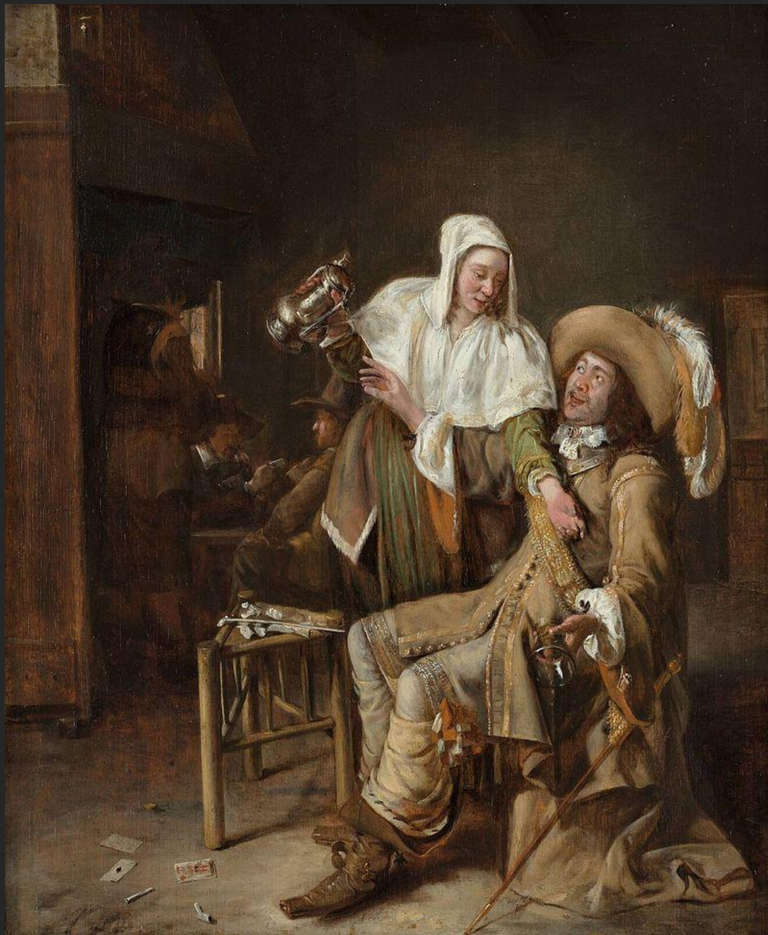
O copo vazio, 1652.