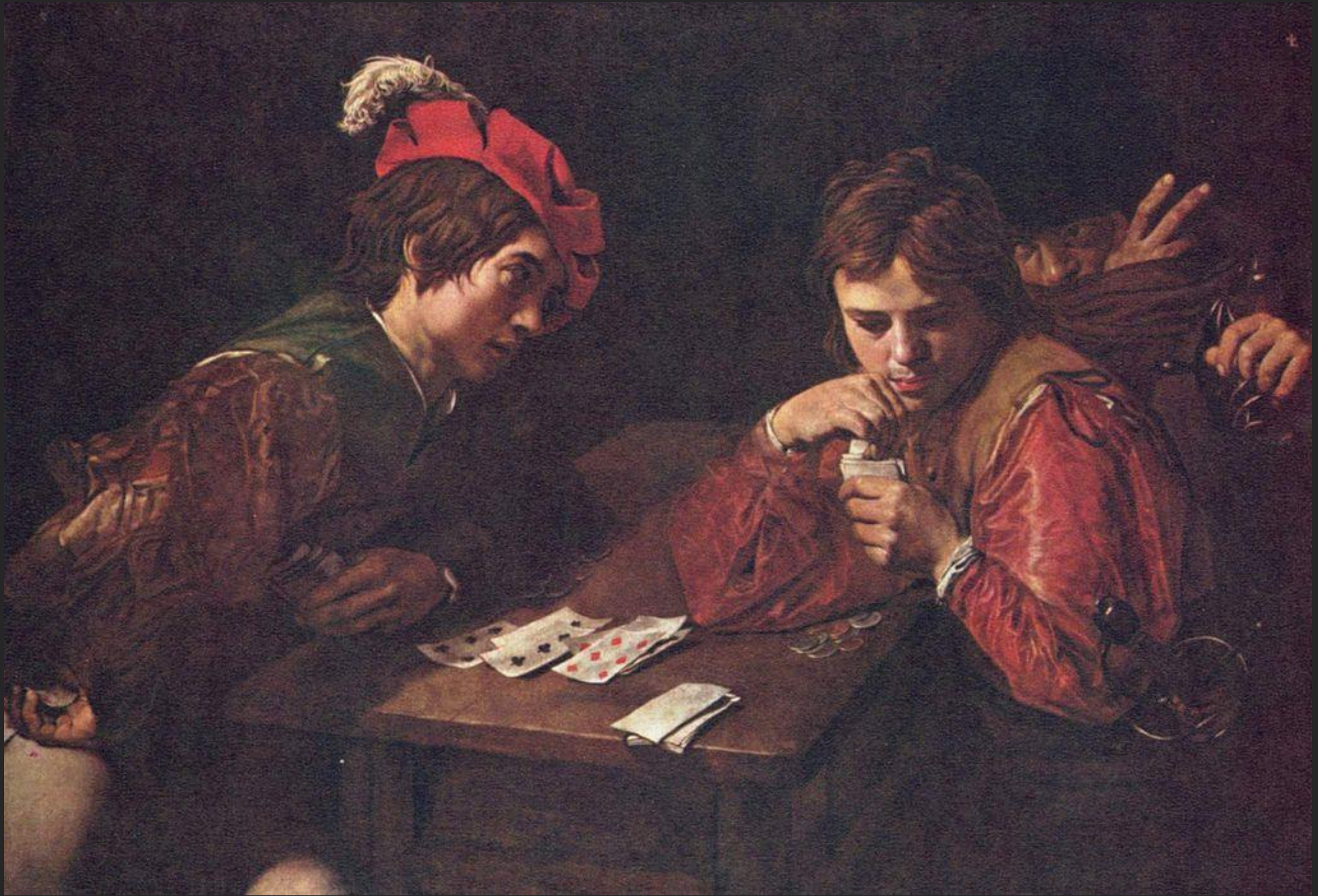
O bar, 1615-18.