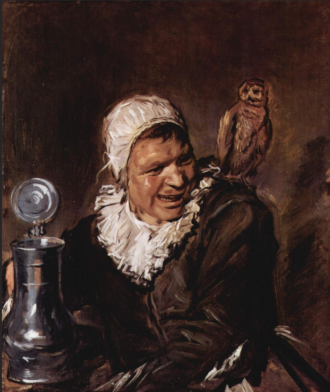
Malle Babe, 1633-35.