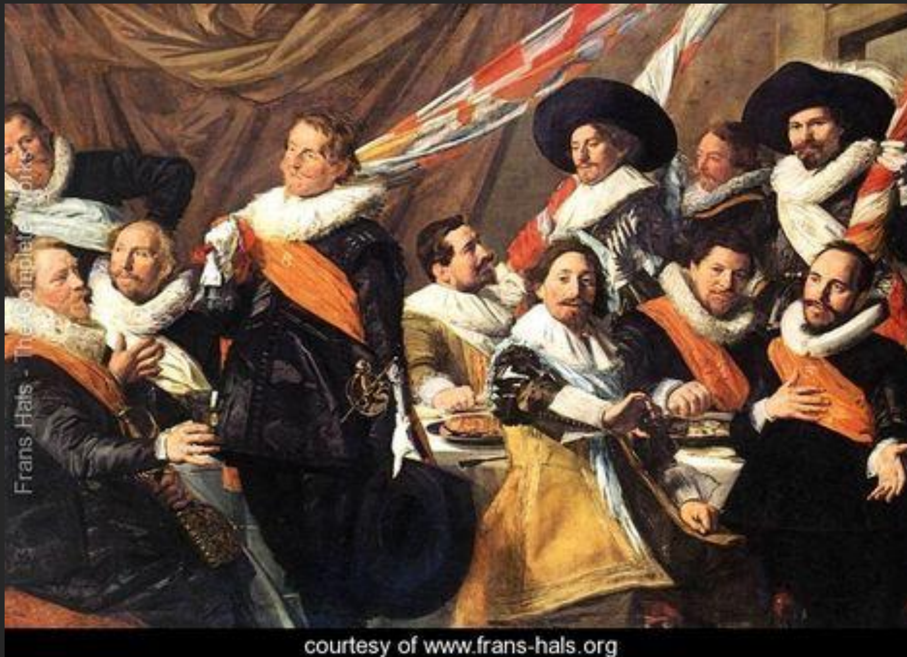
Banquete de oficiais da guarda, 1627.