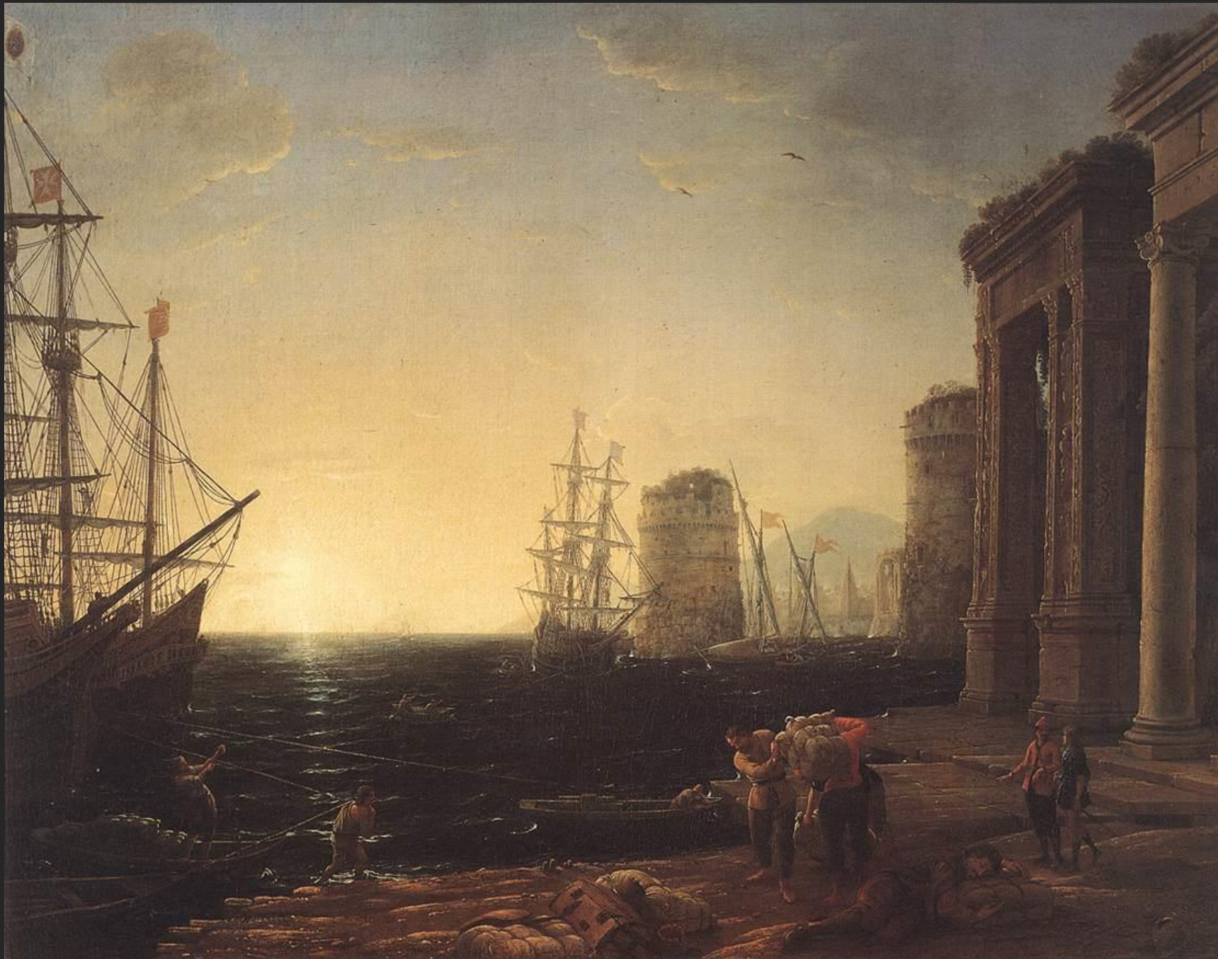
Porto ao por do sol, 1634.