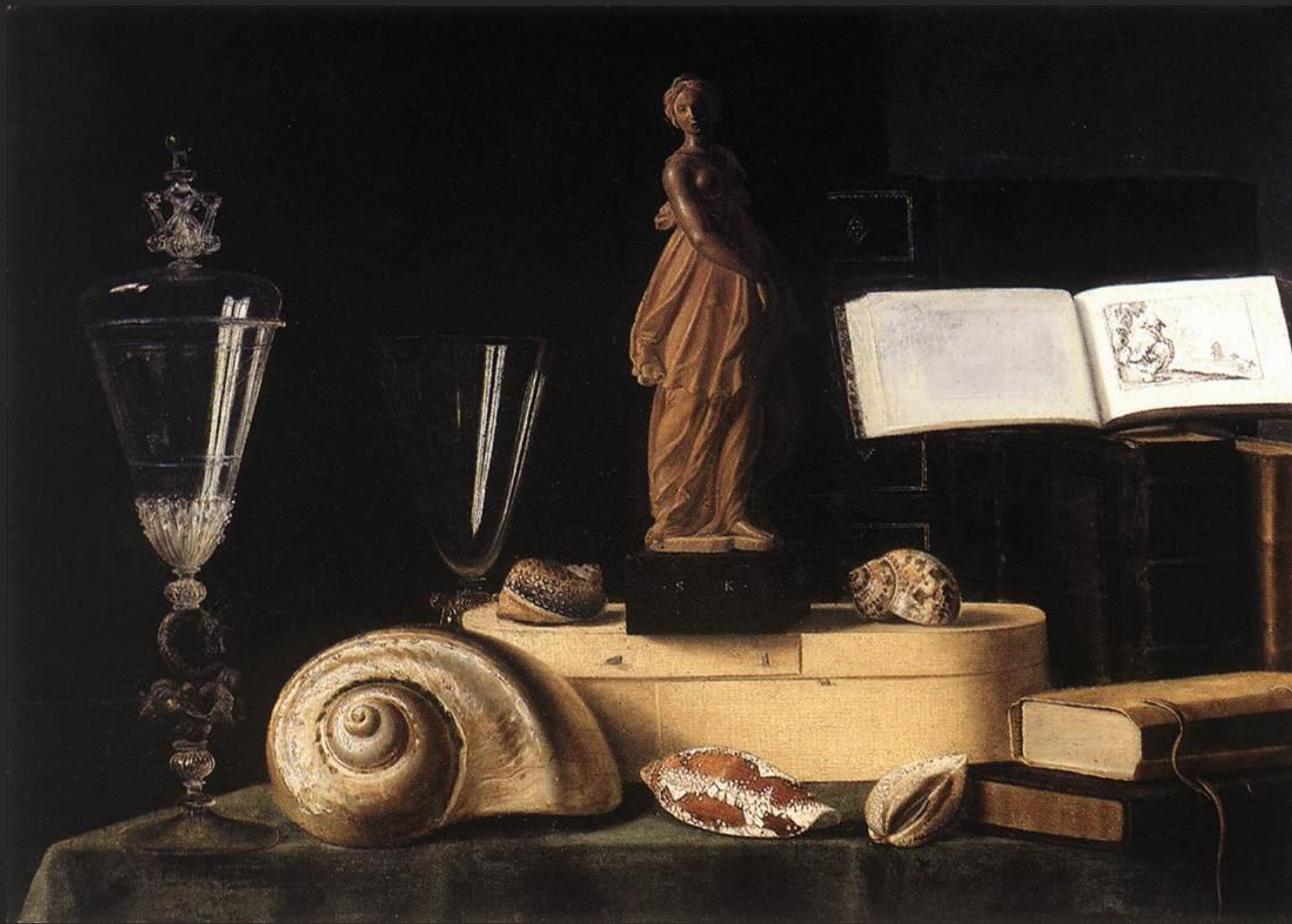
Natureza morta com conchas, 16