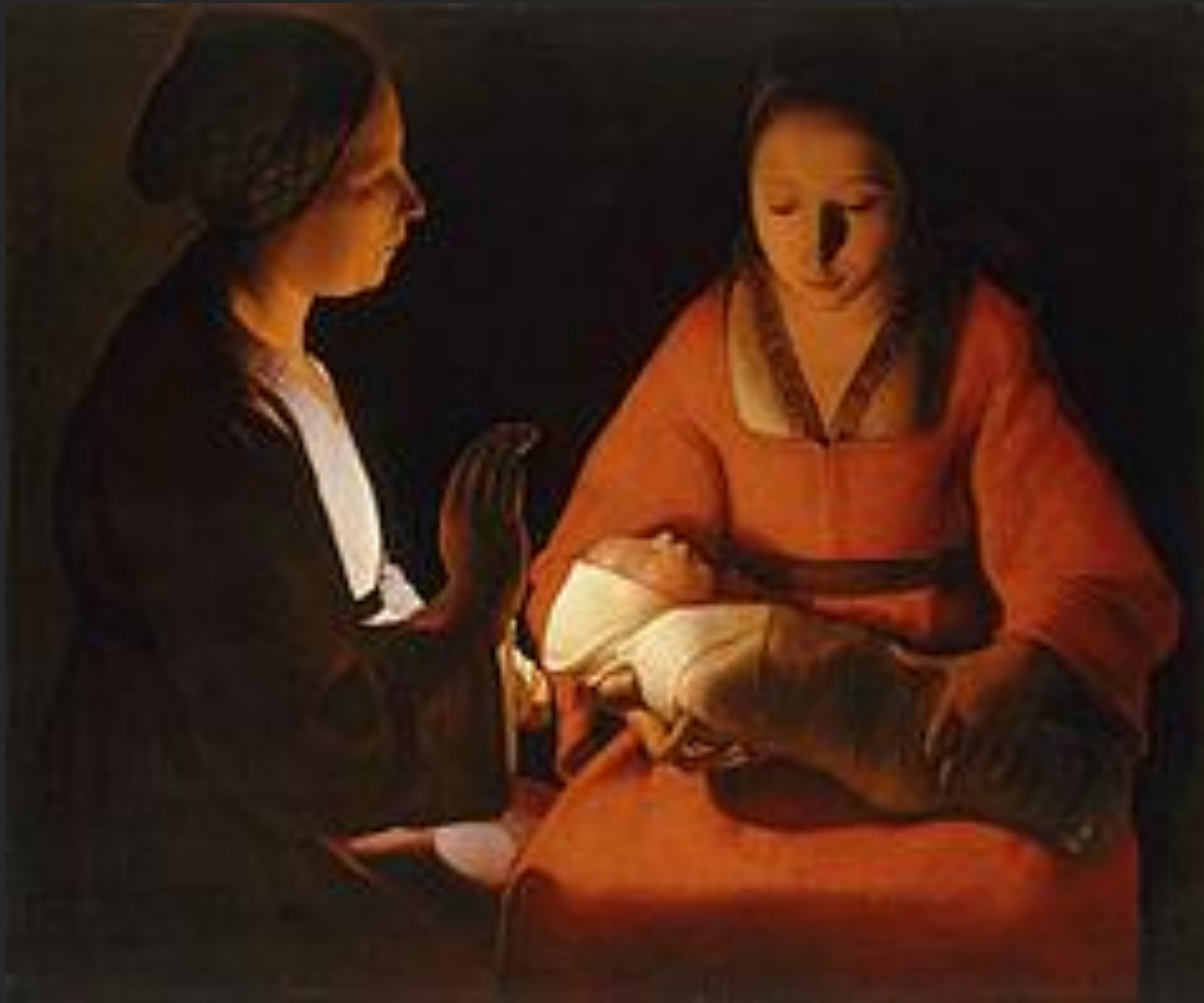
Recém nascido, 1645-48.