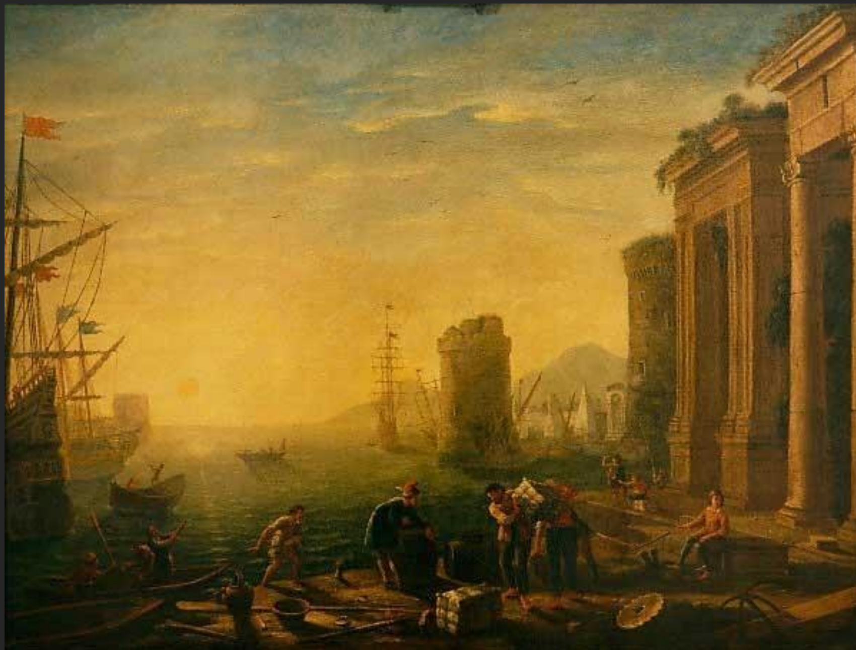
Manhã no porto,