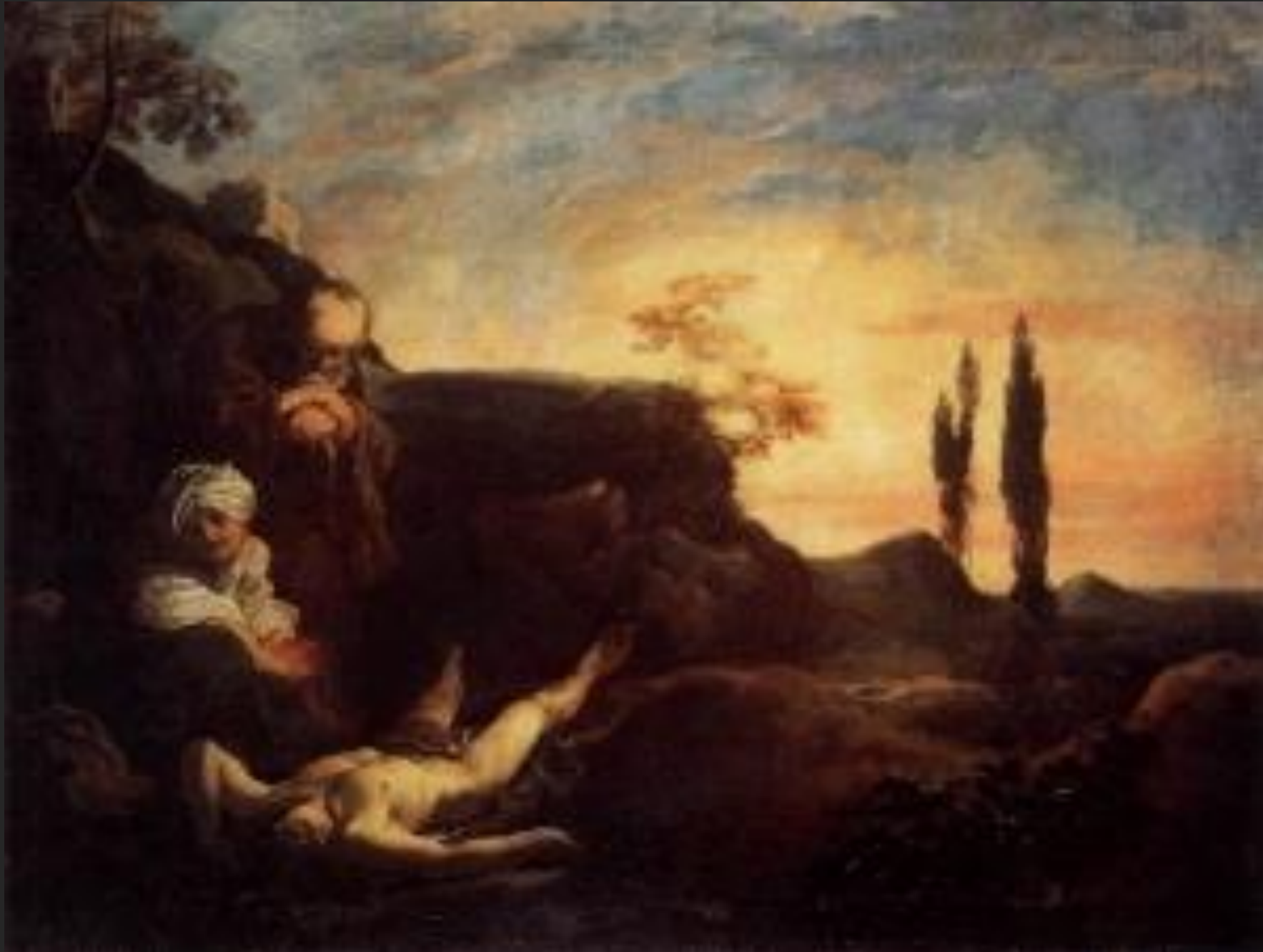
Adão e Eva oram por Abel, 1624-29