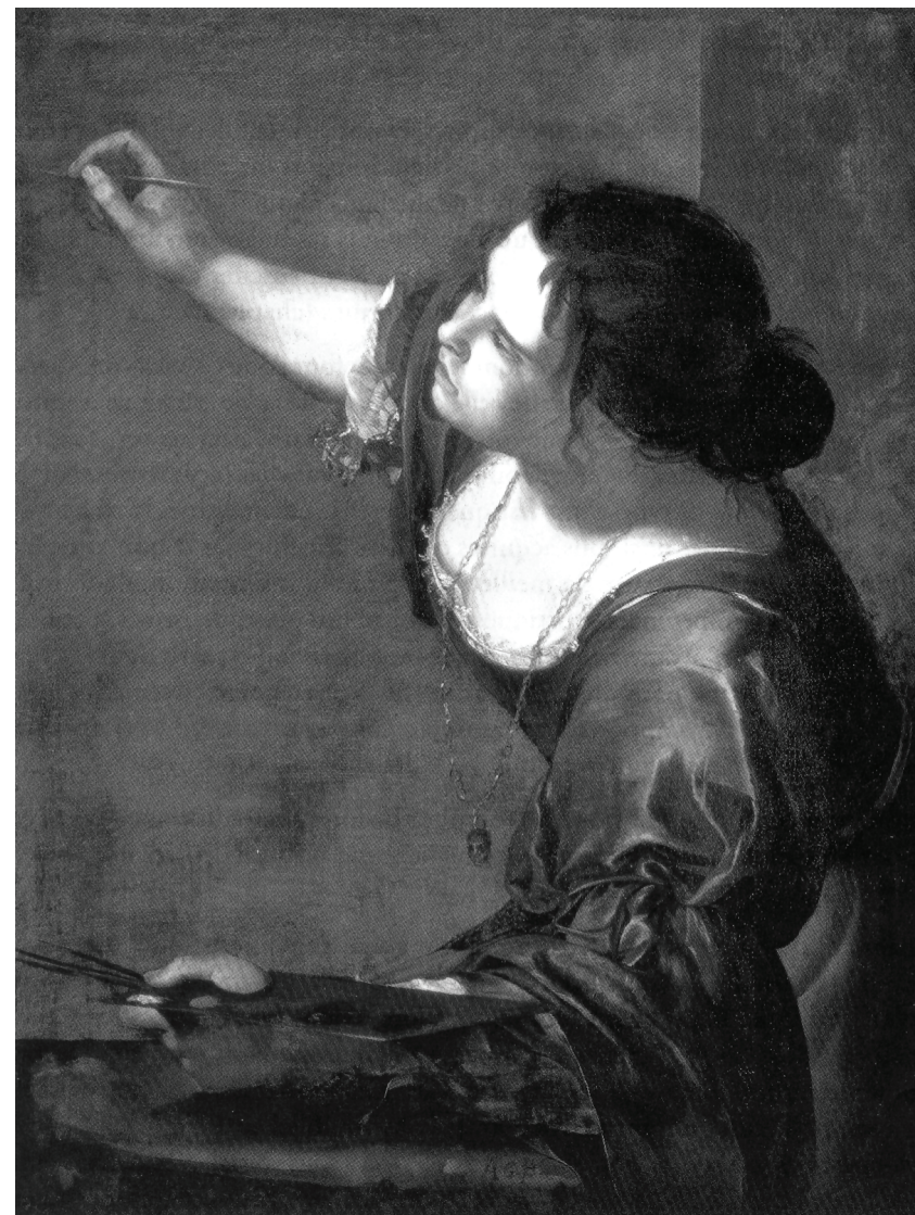
Artemisia Gentileschi, Autorretrato em Alegoria da pintura . The Royal Collection.

Este livro pretende ilustrar a ascensão paralela da invenção da arte e da economia de mercado, a fatalidade que daí resultou para muitos artistas e, depois, como as tentativas de relegitimação da arte pela sociedade não