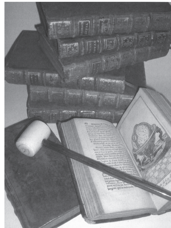
Interencheres.com, foto: Nicole Granger-Jouve, Hôtel des Ventes de Dreux (28).