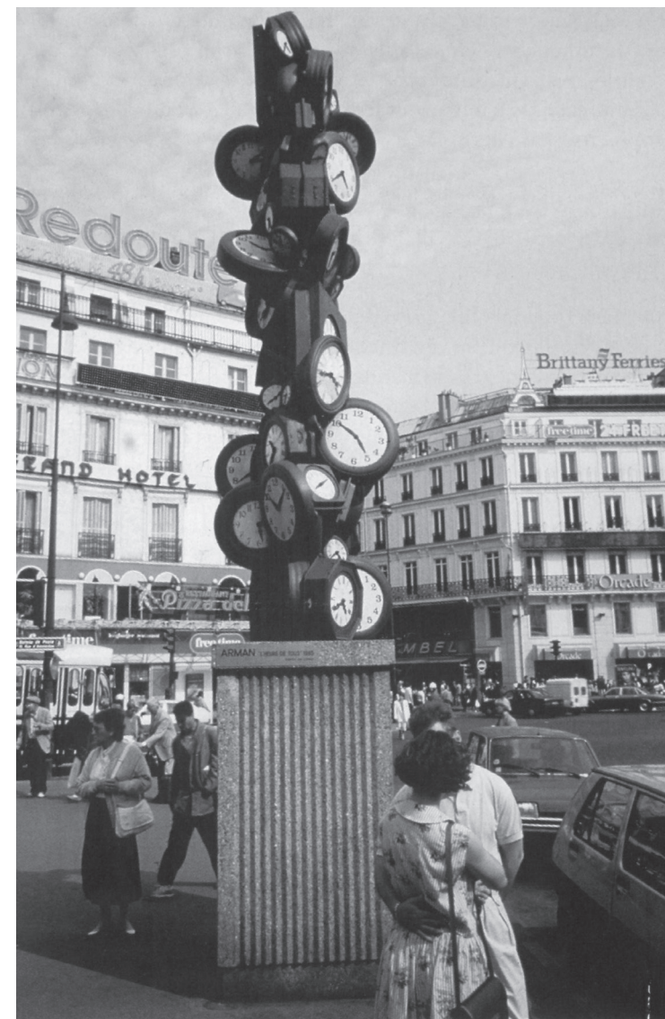
L'Heure de tous , acumulação de Arman, estação Saint-Lazare, Paris, 1985.