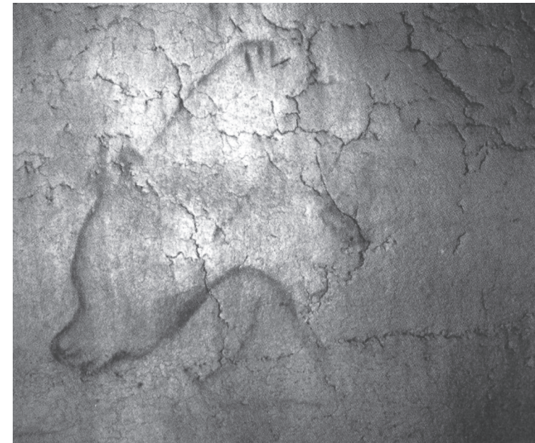
Gruta de Chauvet. Galeria do Cacto. Urso da caverna voltado para a esquerda: traçado vermelho realçado com sombras.