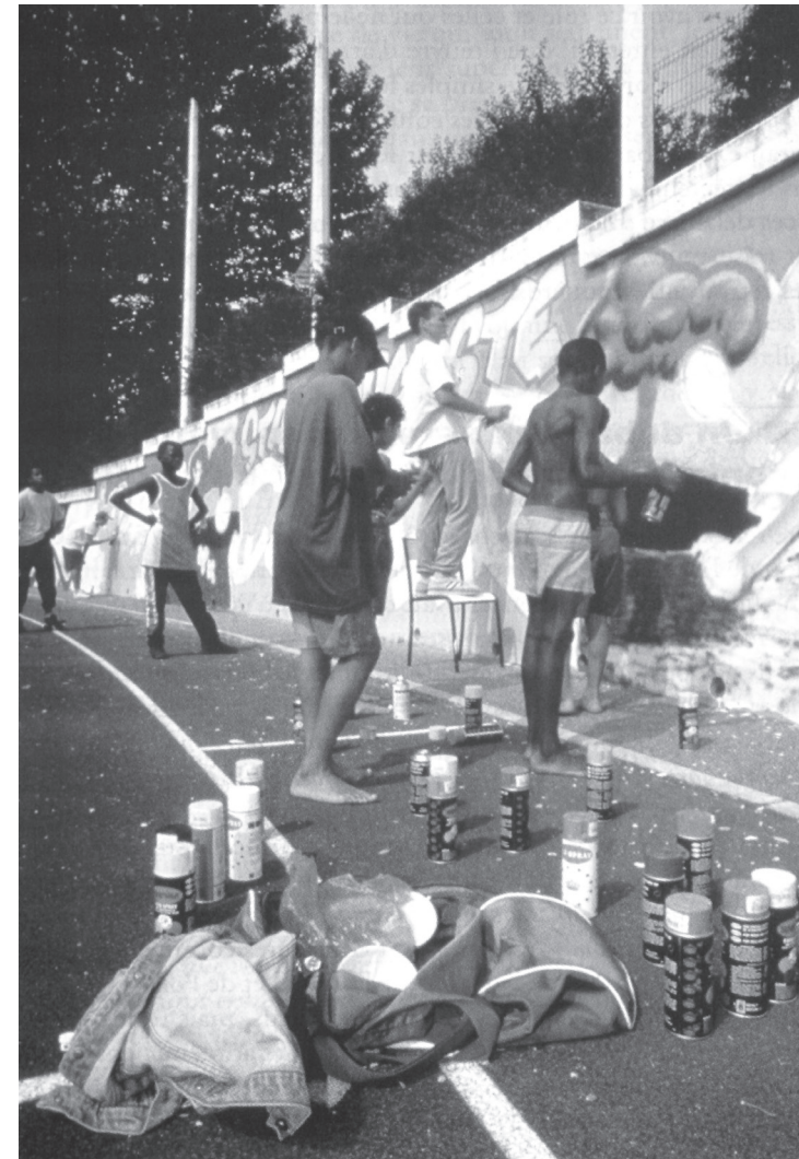
Estágio de grafismo organizado pela cidade, Bezons (95).